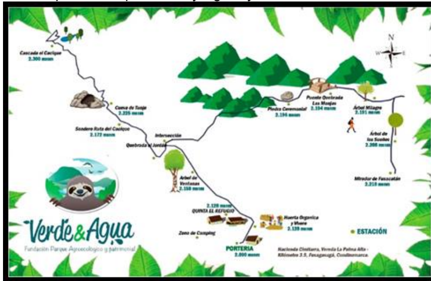
Mapa 2. “Parque Verde y Agua” y sus atractivos Turísticos

En el “Parque Verde y Agua” en la zona de registro, los turistas observan un aviso informativo en el que se describen los dos caminos para realizar el recorrido: “Ruta Pachamama” y “Sendero Ruta del Cacique”, con los respectivos atractivos turísticos por visitar. También se paga el ingreso cuyo valor depende, de la compra del paquete con almuerzo, productos lácteos orgánicos o únicamente la visita.