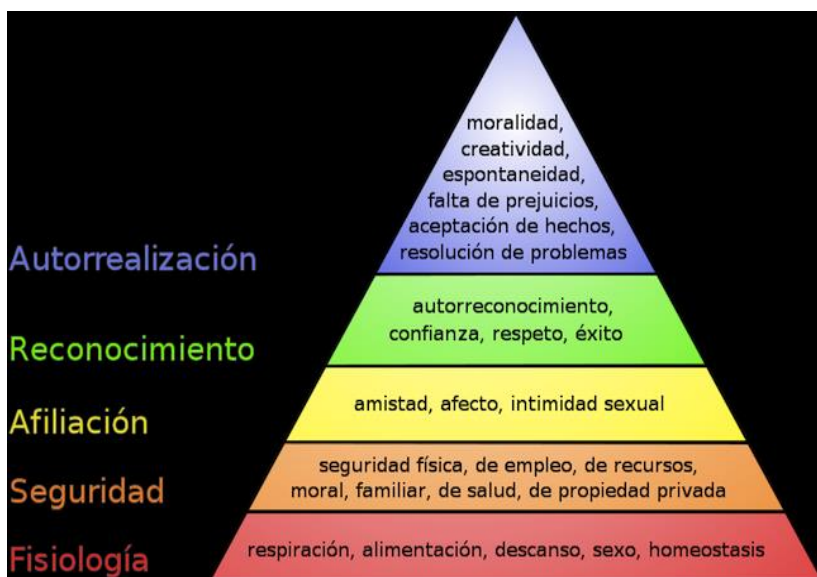
Gráfico No. 2: Pirámide de Necesidades

Aquí encontramos un detalle más profundo de las necesidades que nos plantea el autor en su teoría de las necesidades para alcanzar esa motivación.