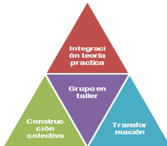
Figura 3. El proceso educativo en el taller.