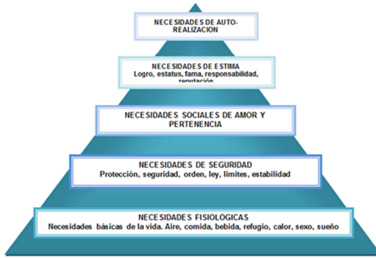
Figura 1. Pirámide de las necesidades de Maslow.

Es importante que nosotros sintamos amor, Maslow en 1991 lo ubica en la parte superior de la pirámide y nos menciona como estas “necesidades superiores hacen que las inferiores, sus frustraciones y satisfacciones, sean menos importantes, menos cruciales, más fáciles de olvidar” (p. 236), así que si se encontrara esa paz, esa tranquilidad, esa libertad para amar todo en nosotros se sentirá mejor, los problemas y las dificultades en la vida serán más llevaderas. Un aporte que también permite cuestionarse en cuanto a la sexualidad humana nos lo menciona Maslow (1991) cuando dice que “si pudiera descubrir la manera de mejorar la vida sexual de incluso un 1%, entonces podría mejorar a la especie entera” (p. 54), así que queda por pensar que hace que la vida sexual en la actualidad no sea lo suficientemente satisfactoria para todos, hasta el punto de llegar a pensar que si lográramos un equilibrio en este aspecto se mejoraría nuestra especie en general.