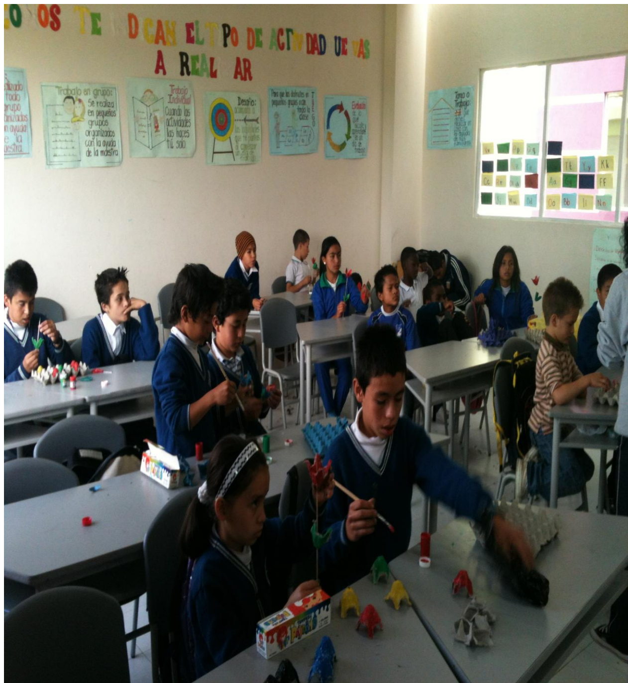
Anexo 4. Artes