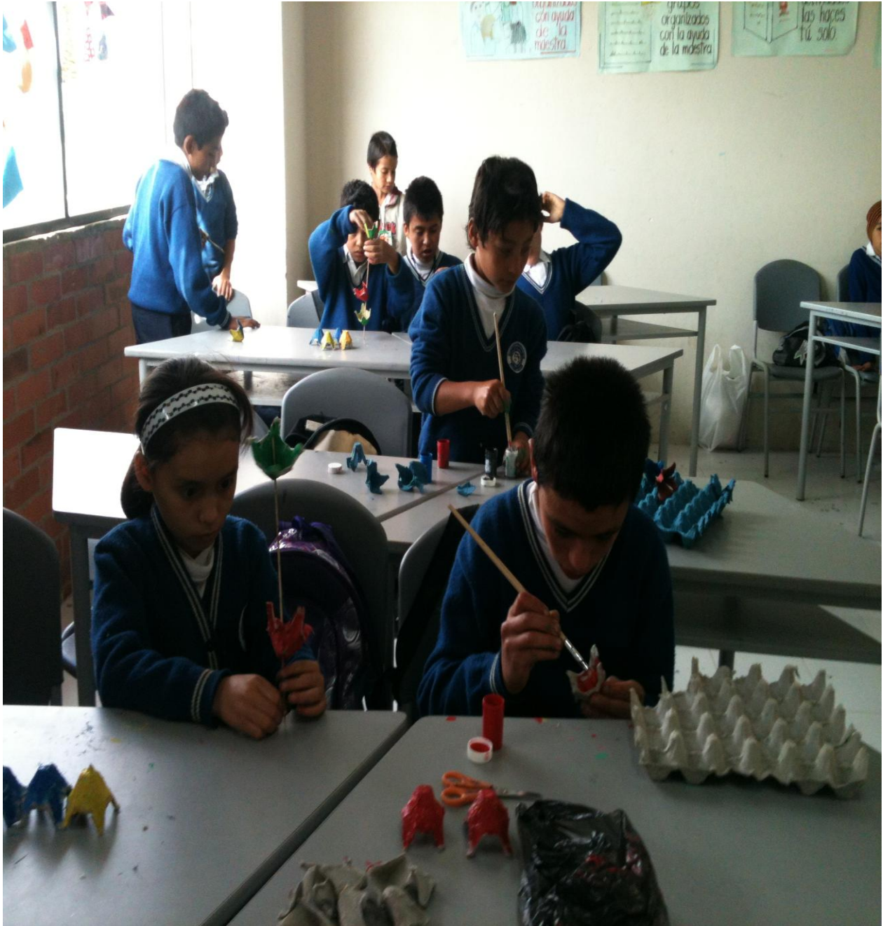
Anexo 7. Artes