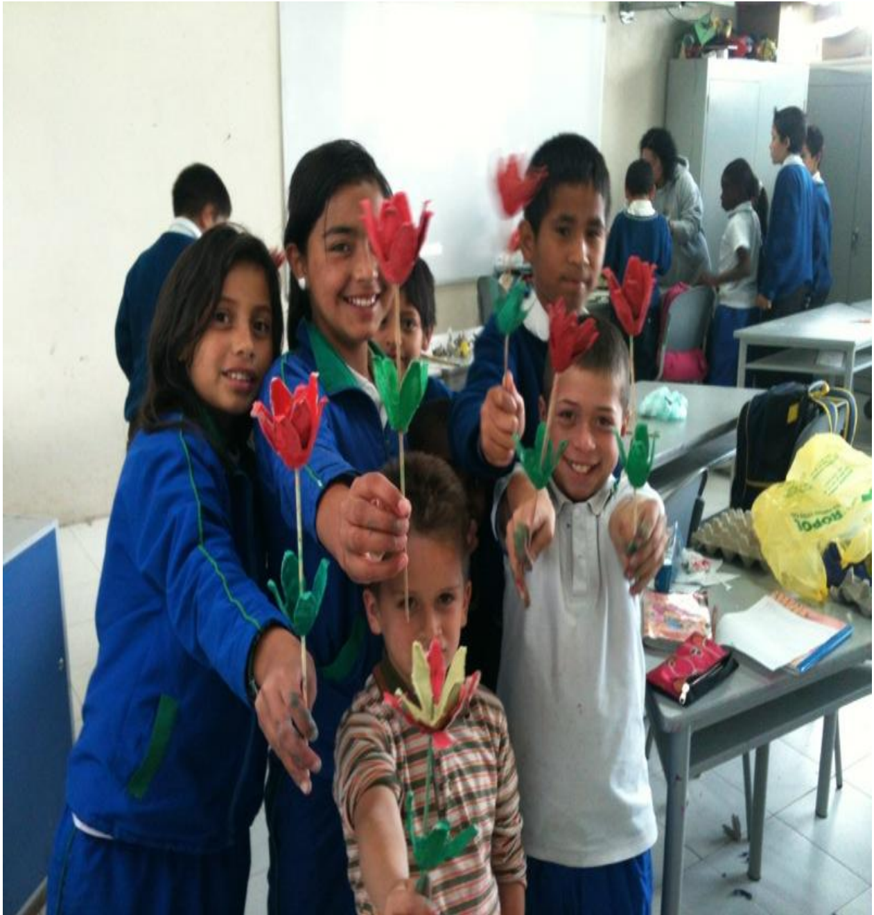
Anexo 8. Resultado Final