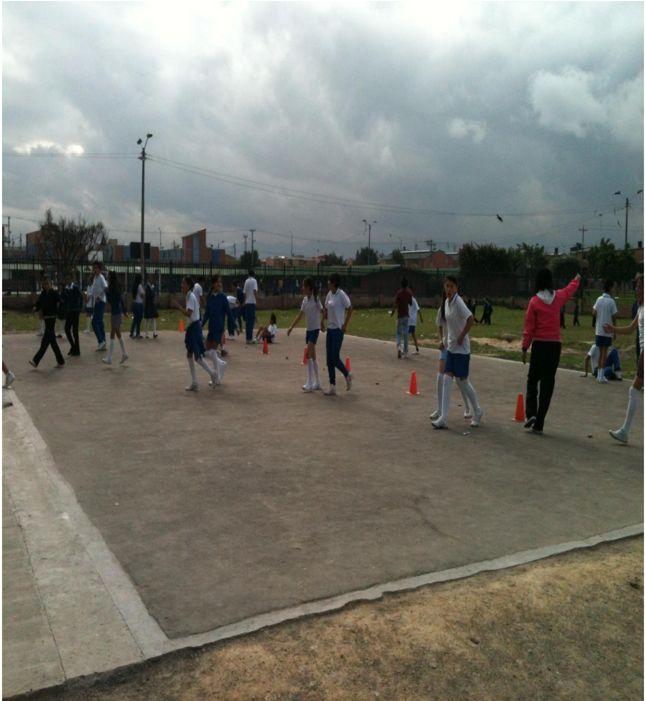
Anexo 9. Juegos