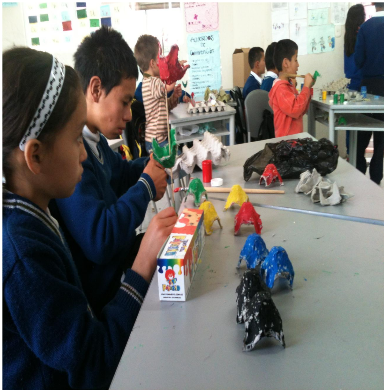
Anexo 6. Artes