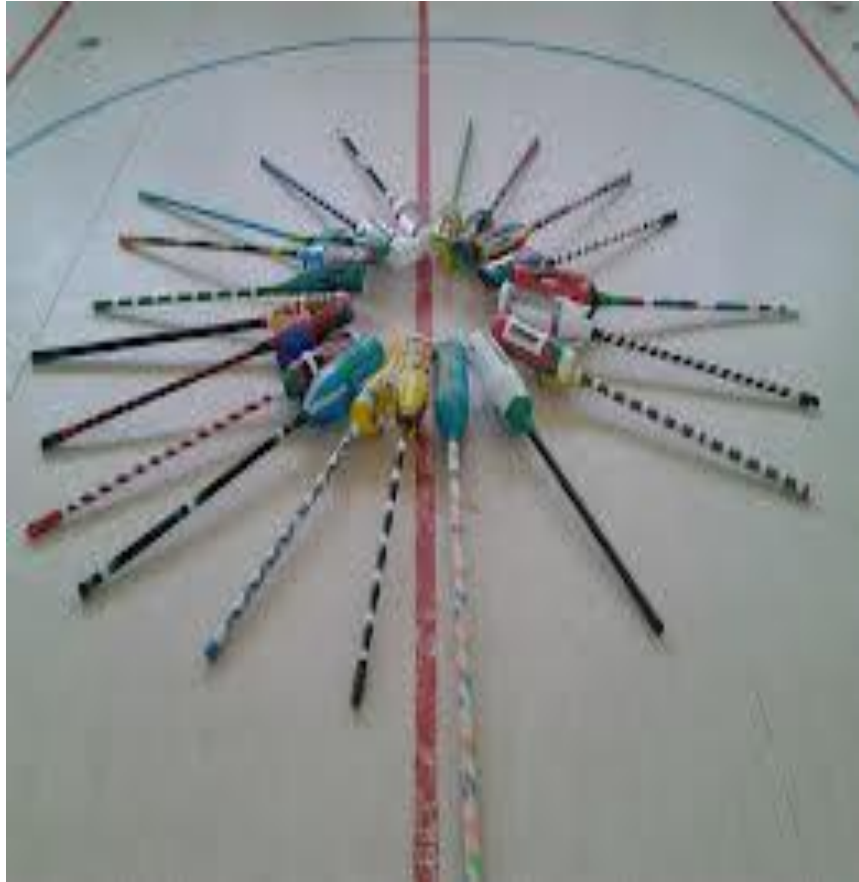
Anexo 18. Material Reciclable