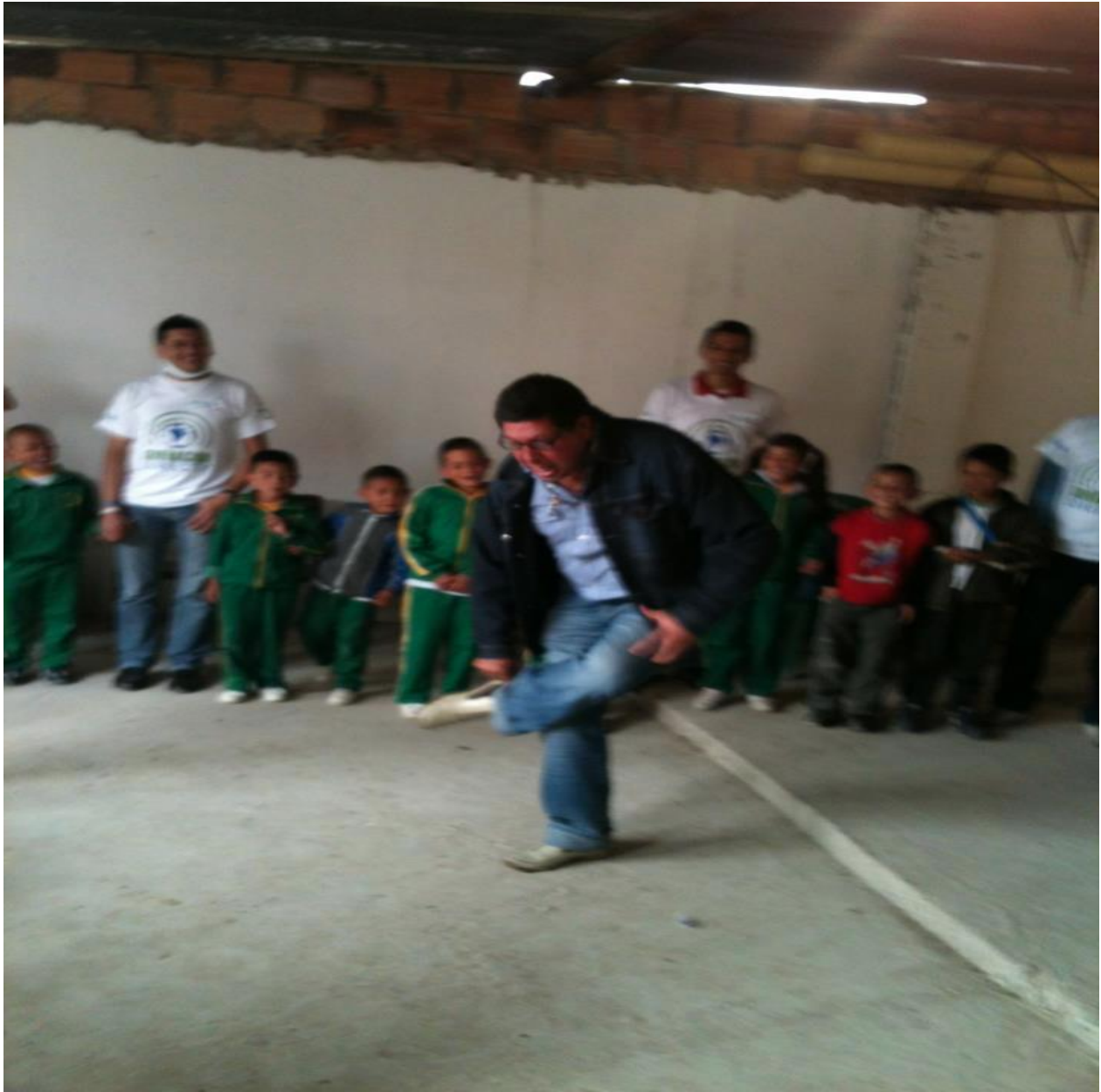
Anexo 21. Padre Misionero