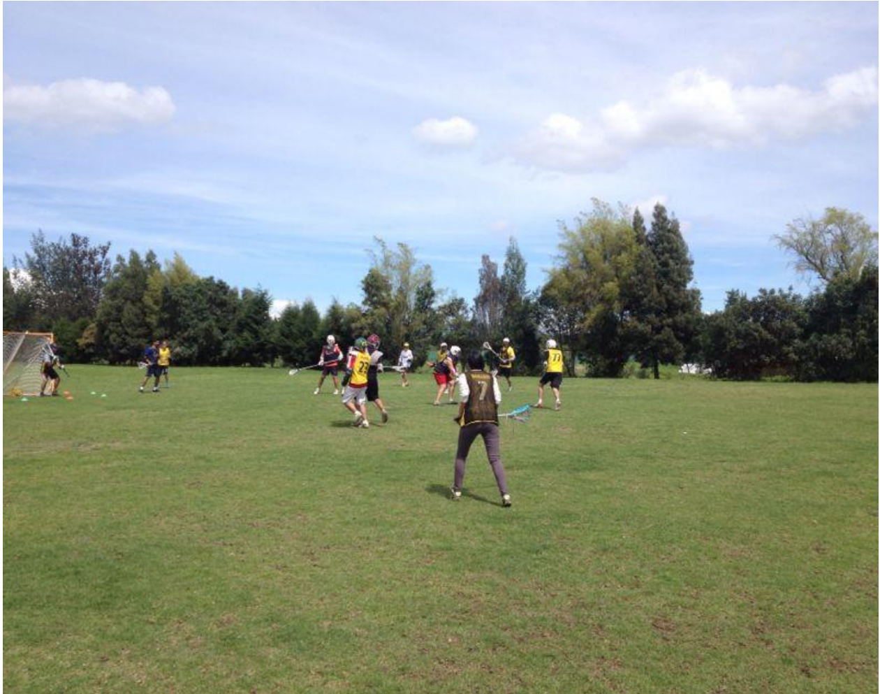
Anexo 16. Puesta en escena del Proyecto.