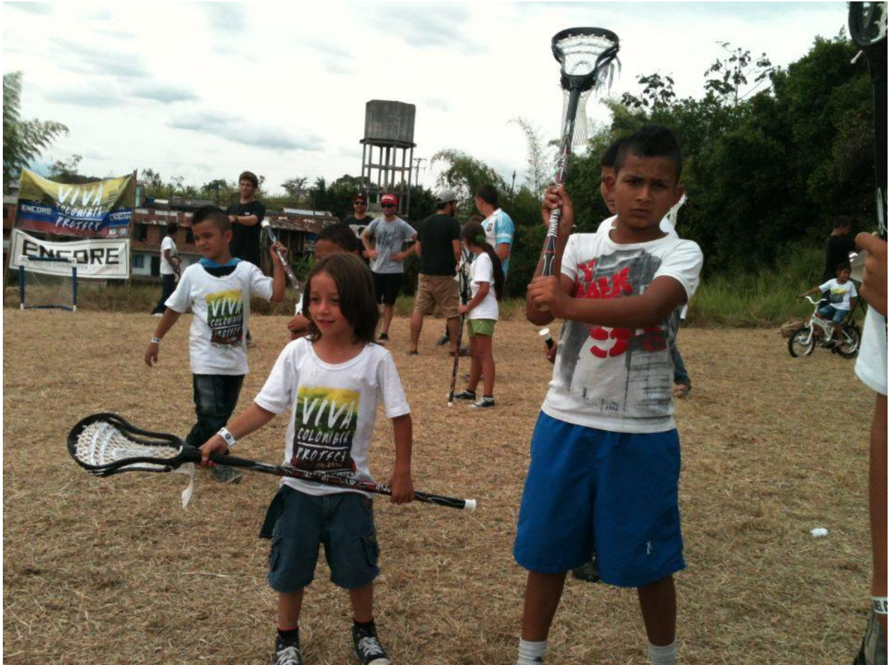
Anexo 37. Niños