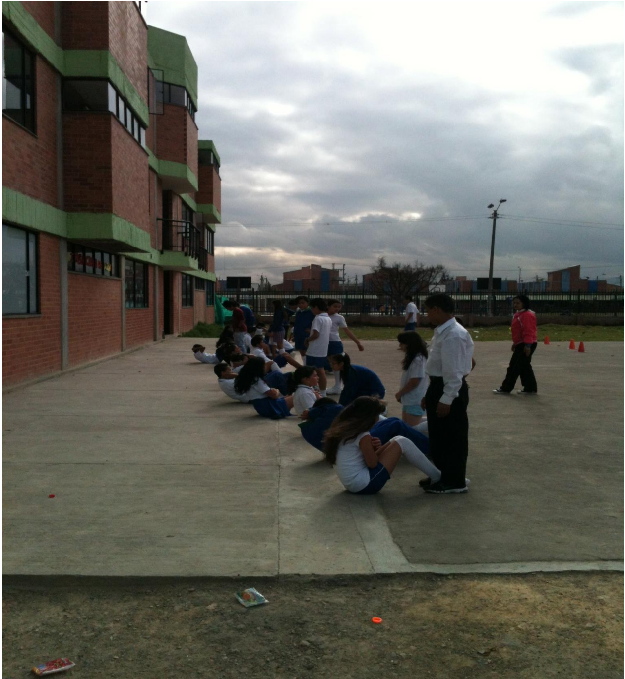
Anexo 10. Juegos