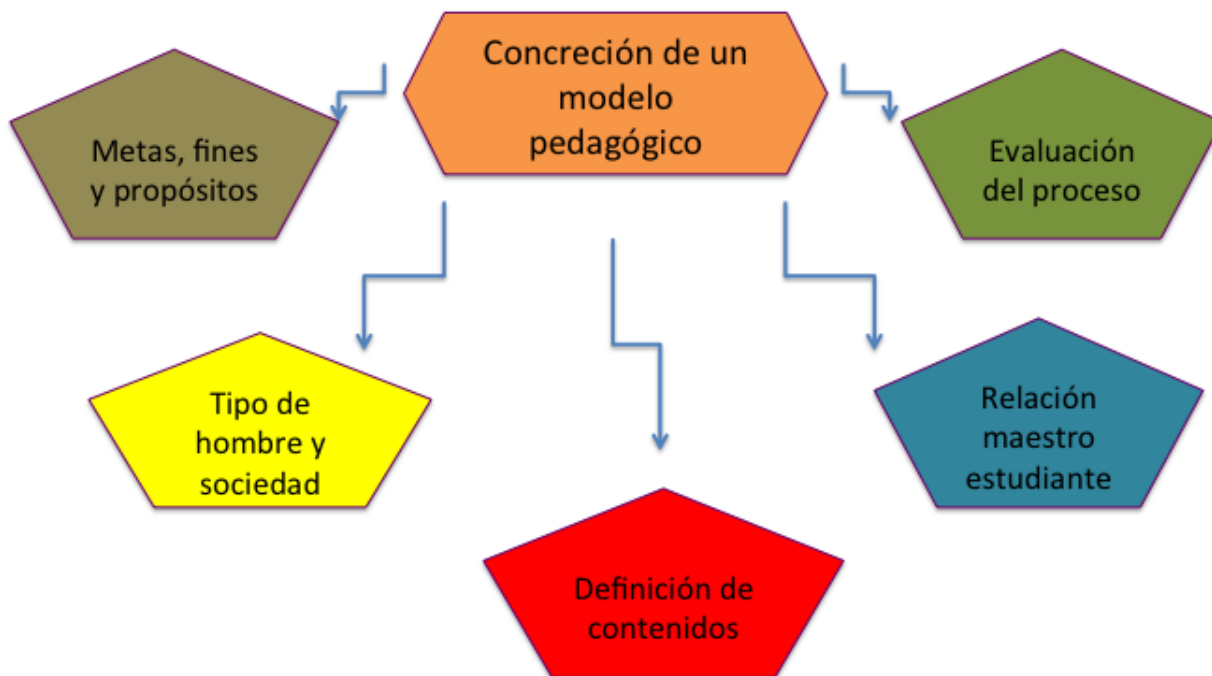
Figura 1. Características del Modelo Pedagógico, Hipólito Camacho.

En el modelo pedagógico social pretende formar seres humanos autónomos y críticos frente a su realidad; ciudadanos que sean capaces de analizar, reflexionar, sacar deducciones y respuestas frente a las problemáticas que se dan en la sociedad, la familia y la escuela. En el modelo pedagógico social de George Posner afirma que el desarrollo de las capacidades del estudiante están determinados por la sociedad, por la colectividad en la cual el trabajo cooperativo y la educación están íntimamente unidos para garantizar no sólo el desarrollo del espíritu colectivo sino el conocimiento científico polifacético, politécnico y el fundamento de la práctica para la formación científica de las nuevas generaciones. Además, el autor señala tres representantes de este modelo, los cuales son: Paulo Freire, Antón Makarenko y Celestin Freinet.