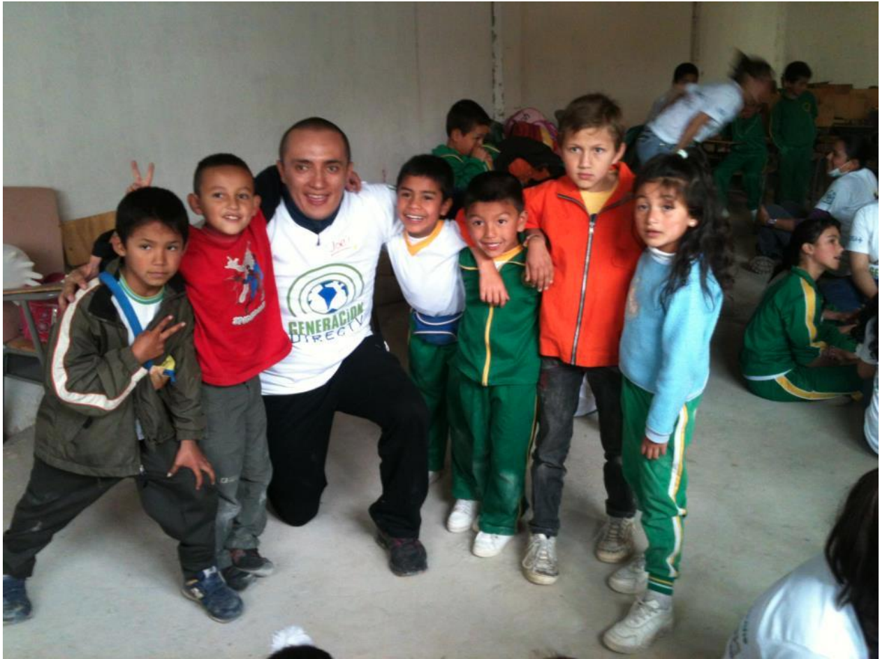
Anexo 23. Niños