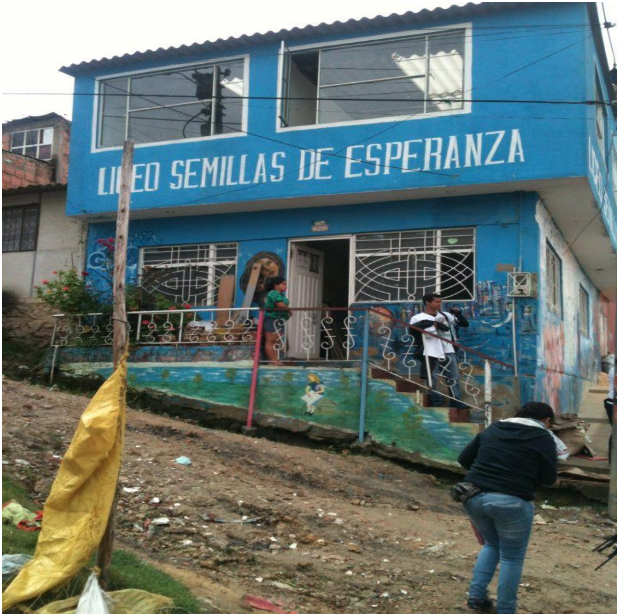
Anexo 20. Colegio Cazuca