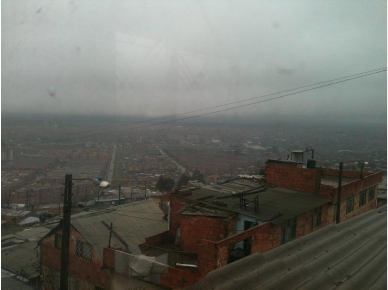
Anexo 26. Cazuca