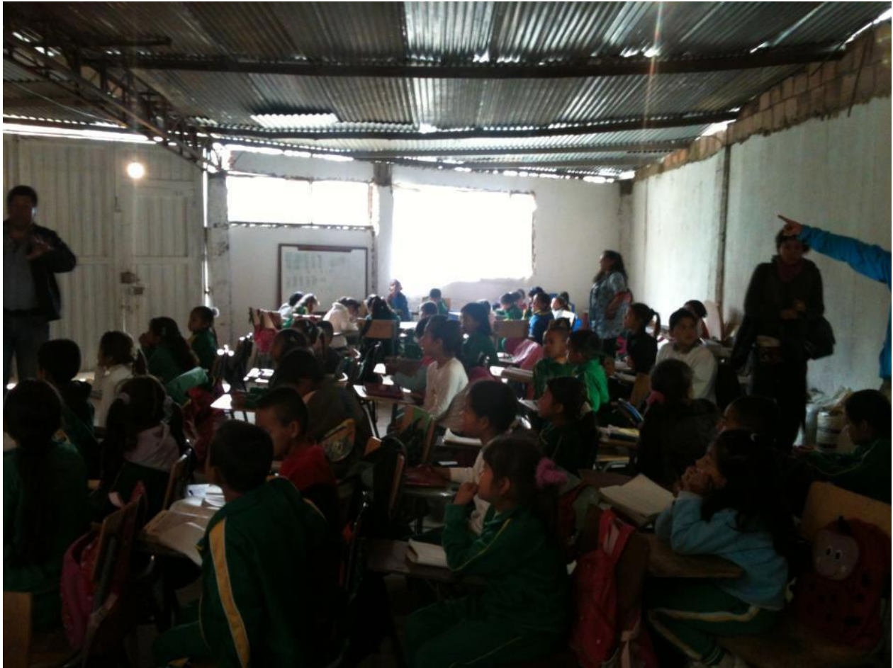
Anexo 27. Colegio Cazuca