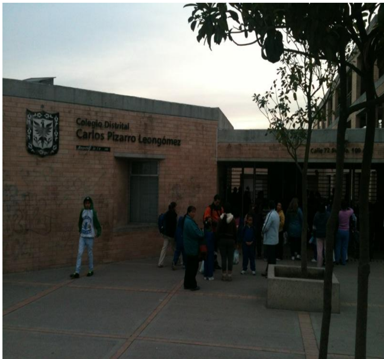
Anexo 1. Colegio Carlos Pizarro León Gómez