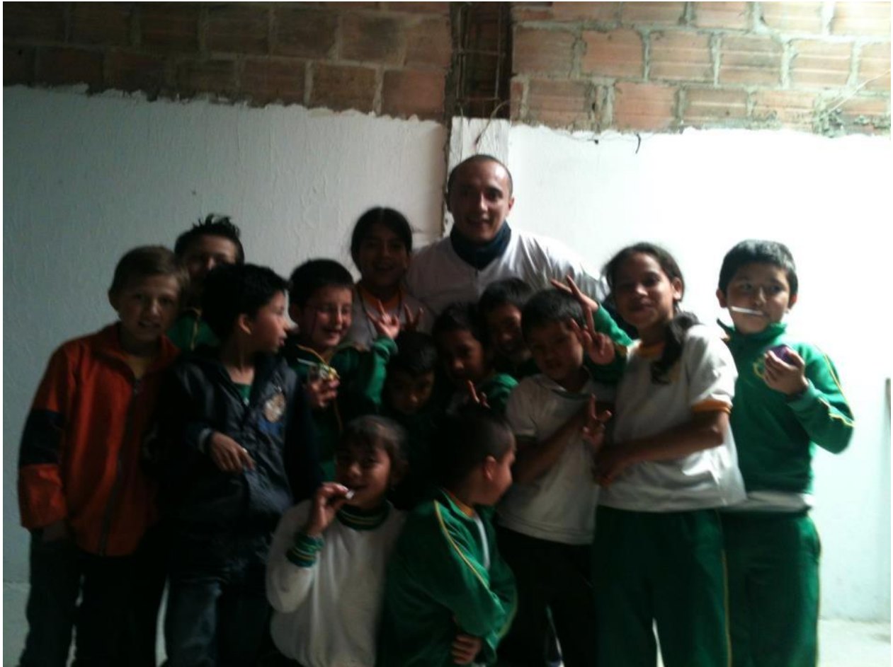
Anexo 28. Niños Cazuca