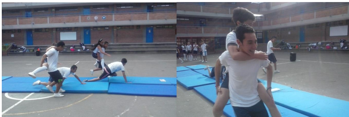
Ilustración 2 manga de coleo, sesión 4

El desarrollo de la sesión, dio como resultado la satisfacción de los participantes, según consenso realizado durante el dialogo, y la voluntad de explorar más formas de prácticas, provenientes de ferias y fiestas en ciudades y pueblos diferentes al bogotano, pues incluso quienes provenían de fuera de esta ciudad, refieren no haber tenido la oportunidad de conocer el folclor de su tierra natal. Con gusto se plantean como una meta para su vida, recorrer el país en busca de nuevas experiencias, y de nuevas formas de sentirse colombianos.