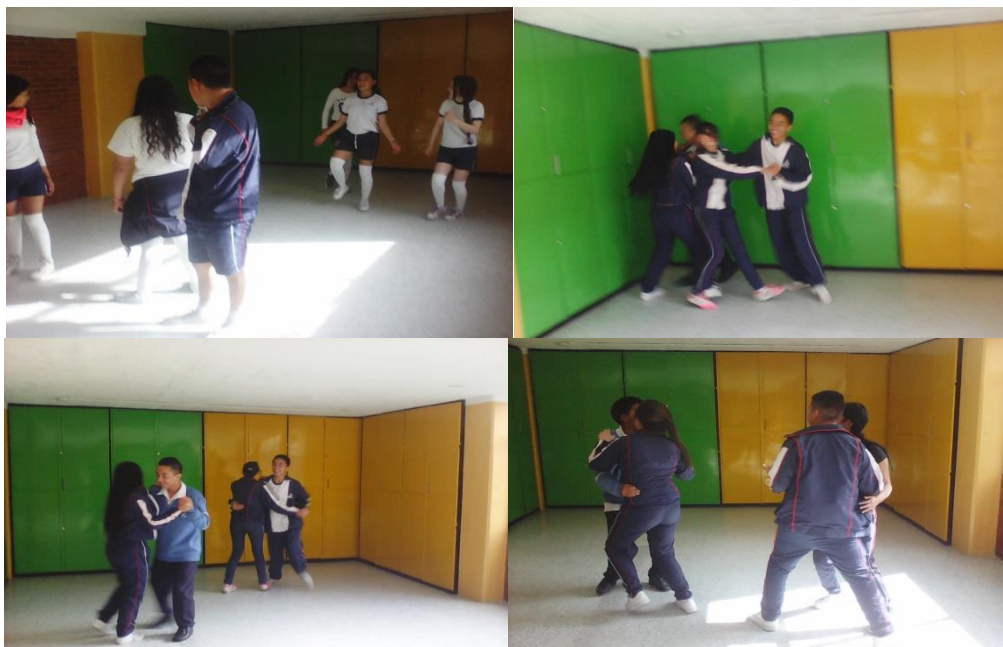
Ilustración 4, Tour dancístico, sesión 6

El seguimiento evaluativo empleado, invitó a dialogar sobre la pertinencia de enseñar esta manifestación a las nuevas generaciones, y casi unánime, fue la respuesta del sí, pero teniendo en cuenta justamente los gustos personales, los gustos familiares y el lugar de procedencia de cada niño, pues, según ellos dicen, “siempre aprenden los mismos bailes y siempre son los de otro lado”