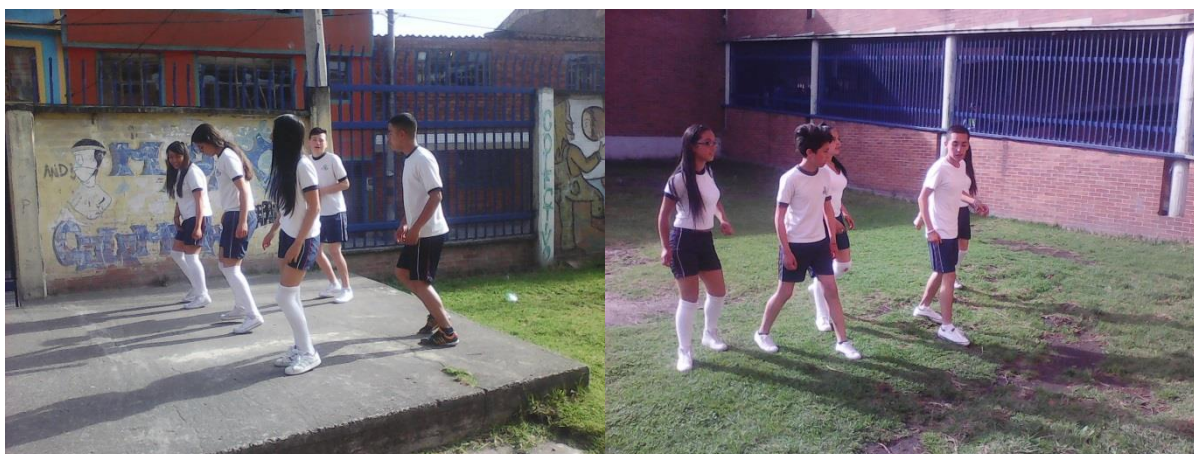
Ilustración 5 momento coreográfico, sesión 7

Ahora los estudiantes no solo están participando de los momentos folclóricos, también están diseñando sus propias experiencias, y ello básicamente, es el elemento que podría garantizar que en un futuro, encuentre formas de aproximarse a nuevas manifestaciones y compartirlas con su entorno familiar, educativo o geográfico. En todo caso, aún es muy superficial, y por lo mismo valdría la pena continuar con el proceso, y en la siguiente sesión evaluar hasta qué punto los individuos han desarrollado verdaderos lazos que les conviertan en difusores y protectores de las tradiciones ancestrales.