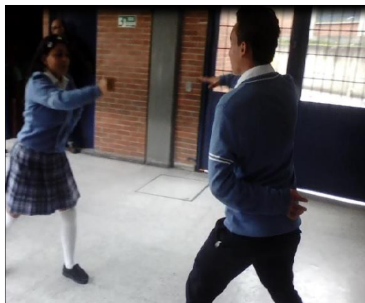
Ilustración 1 macheteando, sesión 1

La pertinencia de esta actividad para iniciar la fase de aproximación se confirma, en el momento en que se solicita el diligenciamiento del formato de seguimiento – el cual puede consultarse en el siguiente apartado de este documento – cuando ante la pregunta “¿considera que esta tradición debería conservarse?” las respuestas más comunes consignadas por los participantes llegaban a una reflexión en la que coincidían la mayoría, resaltando que para ellos fue muy interesante ver como una creación para la guerra, ahora estaba al servicio del arte y la cultura, como lo que antes fue entrenamiento para matar, ahora puede dar vida a nuevos aprendizajes.