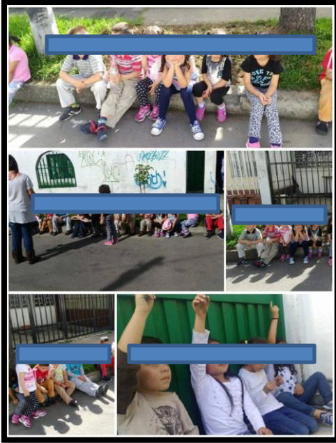
Ilustración N°9: Niños y niñas opinando en la