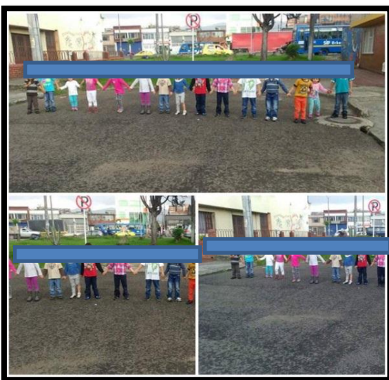
Ilustración N°13: Somos UBUNTU.

En esta intervención se evidencian aspectos de la pedagogía del cuidado desde la corresponsabilidad, en tanto que los niños y las niñas mostraron un compromiso conjunto por buscar soluciones para resolver la situación y cumplir con el objetivo de “ser porque somos”. Esta categoría también se hace visible ya que los niños y las niñas para llevar a cabo acciones en grupo aplican elementos desarrollado anteriormente en esta propuesta como el reconocimiento así el otro y la confianza, aspectos que contribuyen a una interacción basada en el pensar también para el otro y desde las circunstancias del otro sean visibles aparentemente o no.