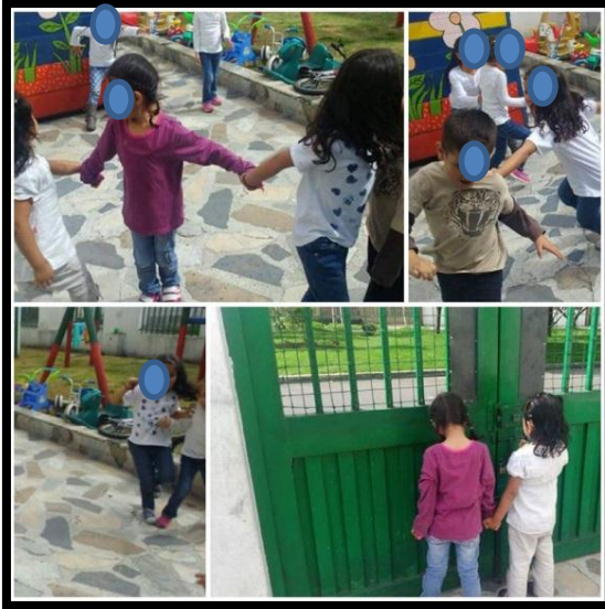
Ilustración N°14: Intervención de cadenas