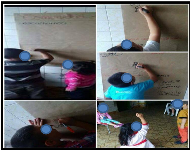
Ilustración N°2: Niños y niñas

Se hace evidente en esta intervención aspectos relevantes de la Pedagogía del Cuidado, en su componente de corresponsabilidad, siendo esta una responsabilidad, un compromiso o un acuerdo que se hace en común entre dos o más personas. Vemos entonces cuando los niños(as) van proponiendo sus acuerdo y luego son ellos quienes llaman la atención si no se cumplen.