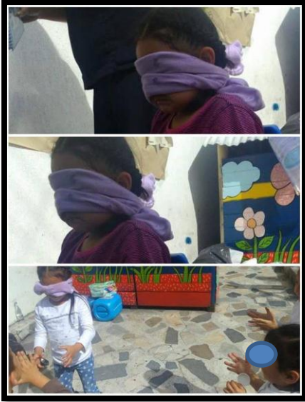
Ilustración N°10: Niños y niñas cazando aplausos,