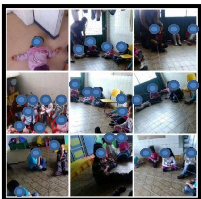
Ilustración N°4: Niños, niñas y maestras en formación tejiendo palabras de amor en busca de fortalezas.

Se hicieron evidentes aspectos de la pedagogía del cuidado, pues desde la comunicación generada en la red de fortalezas se hicieron evidentes actitudes de cuidado frente al otro teniendo como punto de partida <la mirada que tiene el otro de mi > para luego tener ser apropiadas en el auto-reconocimiento. Es entonces en donde se encuentra una corresponsabilidad en cuidar y ser cuidado.