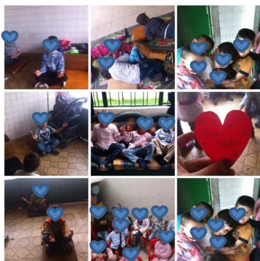
Ilustración N°16: Collage de meditación, abrazos

Las relaciones de cuidado toman relevancia basadas en el modelo educativo moral de Nel donde el diálogo hace parte de la confirmación de acciones, pensamientos y sentires desde la ética de cuidado.