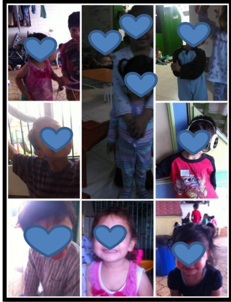
Ilustración N°17: Collage de los niños y niñas tiempo después de terminada la propuesta pedagógica cuidado al natural.