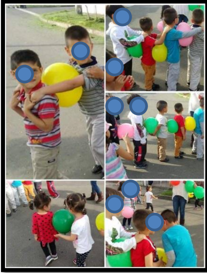
Ilustración N°15: Manejando trenes desde la unidad,