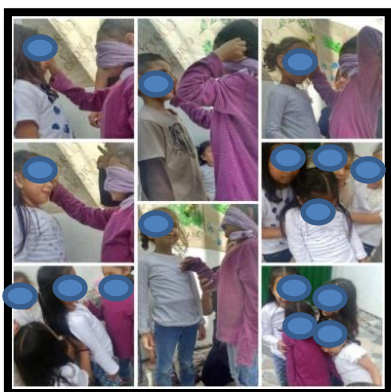
IlustraciónN°7: Las niñas (os) de Casa Sofía en busca de la confianza

En esta intervención se evidencia la pedagogía del cuidado como la de relaciones de cuidado. La primera está presente en cuanto a que la confianza es un componente de esta pedagogía, porque si bien es una base para generar y permitir el cuidado entre una persona y todo lo que lo rodea, además es una de las fuentes rectoras de esta fase en general; en la segunda categoría < relaciones de cuidado> se evidenció ya que desde la confianza es donde se pudo permitir cuidar y ser cuidados. Además en las relaciones permite la construcción de un vínculo seguro que permite de modo más eficiente el cuidado