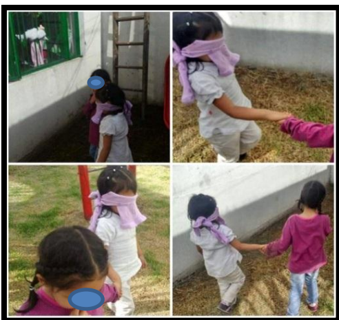
Ilustración N°8: Intervención del rescato,

En este taller fue posible evidenciar la confianza como un elemento fundamental en la categoría de análisis de pedagogía del cuidado ya que puso de manifiesto acciones pertenecientes a esta pedagogía como la posibilidad de confiar en el otro para contribuir al desarrollo de relaciones de cuidado, sino que en esta se evidencia un apoyo mutuo contante que da cuenta de un interés natural por el otro