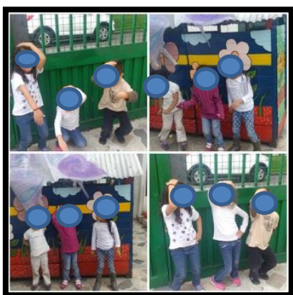
Ilustración N°3: Niños y niñas imitando a sus compañeros en el juego de mimos.

En esta intervención se rescata la Pedagogía del Cuidado, cuando los participantes reconocen desde la interculturalidad, la individualidad como una fortaleza que los hace únicos y a partir de esto fueron creando no solo auto-reconocimiento, sino también confianza en sí mismo y en el otro, además durante el proceso del juego “mimos” generaron construcciones de trabajo en equipo. Siendo estos componentes relevantes de esta pedagogía, los cuales permiten confirmar que el sujeto más allá de mirar en el otro características diferentes a las propias busca a través del reconocimiento generar procesos de constante interacción.