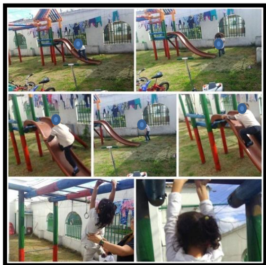
IlustraciónN°6: los niños y niñas de Casa Sofía descubriendo fortalezas a través de pistas de obstáculos

desprenden las relaciones de cuidado; además de este también se hace presente el trabajo en equipo que es uno de los componentes de esta pedagogía.