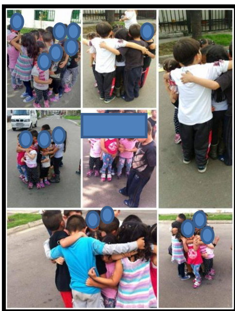
Ilustración N°12: Intervención del círculo de la solidaridad realizada por los niños y niñas

En este taller emerge elementos de la pedagogía del cuidado ya que pone de manifiesto una constante reflexión frente a ser consiente en relación a lo que el otro necesita el otro de mí? En este caso para poder alcanzar un objetivo en común, se hace notable una constante preocupación y deseo de poder responder a las necesidades del otro, de situarse en la posición del otro y gestionar estrategias como el dialogo para lograr el bienestar no solo individual sino común, asimismo también se visibiliza las relaciones de cuidado en tanto muestra el cuidar y ser cuidado ya que en esta intervención como tal todos se preocupaban por los participantes de menor edad para que cumplieran con el objetivo sin dañarlos o afectarlos física y emocionalmente.