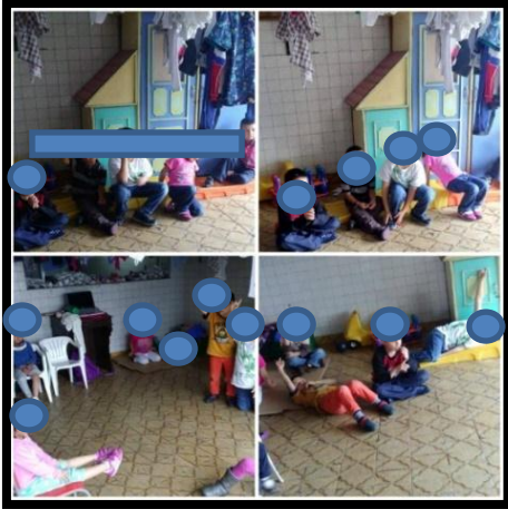
Ilustración N°11: Intervención de reflexiones hechas por los niños y niñas, dialogando sobre dilemas morales reales

Se evidencia una segunda intervención de dilemas morales en este caso son más cercanos a la realidad, en esta ocasión se observó una apropiación significativa de los acuerdos de la asamblea, pero también se logró por medio del diálogo una confrontación argumentativa que concluyó con un consenso de las resoluciones a ser aplicadas.