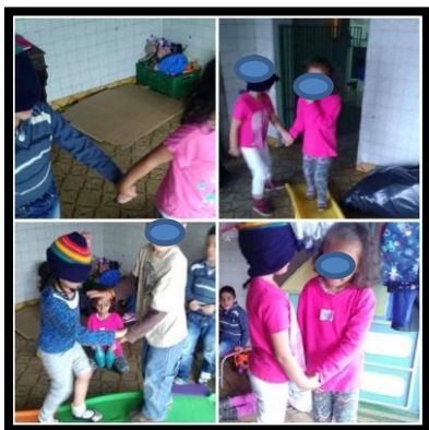
Ilustración N°5: Niñas y niños guían a sus compañeros por la pista de ojos vendados.

En esta intervención fue posible evidenciar elementos relacionados con las relaciones de cuidado ya que se puso de manifiesto actitudes claras de cuidado frente al otro y de sus necesidades, pero sobretodo una comprensión a los miedos del otro y a la posibilidad de ayudar frente a la superación de este.