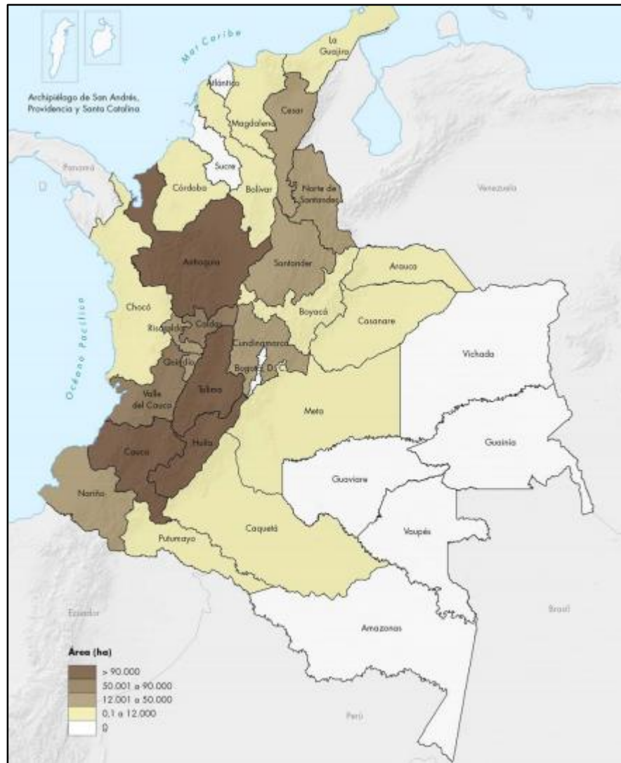
Figura 2: Área de cultivos de café

Aunque la cosecha de café es el modo de subsistencia de los campesinos en el departamento, las condiciones para su comercialización resultan ser bastante elevados en términos económicos: