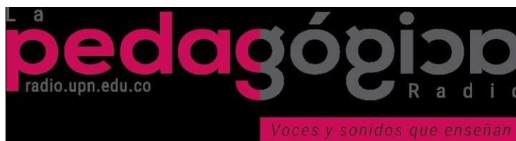
Logo de la emisora

La emisora cuenta con treinta y ocho (38) programas radiales que apuestan por la difusión de contenidos educativos. De ellos seleccionamos inicialmente diez programas e intentamos descifrar las coincidencias existentes en términos de recursos, audiencias y pretensiones comunicativas. El resultado fue un archivo de la emisora que esquematizamos en una matriz descriptiva compuesta por el nombre del programa, su contenido, recursos y audiencia a la que va dirigida.