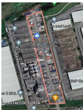
vista mapa satelital delimitada