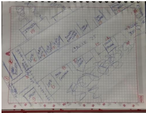
Boceto de cartografía 15 febrero 2023

Diseño del barrio elaborado a mano alzada