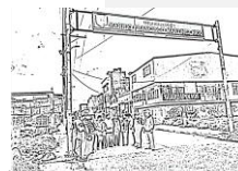
Saberes Danzantes De Martínez Rico.

La historia de vida permite una reflexión dialéctica sobre las percepciones personales de la propia práctica su sentido, sus contradicciones, y el pensamiento. Es así como da origen al conocimiento de los aspectos que quedan por solventar para los que no se tiene respuesta y sobre los que se busca información y conocimiento. Al decir de Hernández Sampieri et al. (2014), la historia de vida: 119 Puede ser individual (un participante o un personaje histórico) o colectiva (una familia, un grupo de personas que vivieron durante un periodo y que compartieron rasgos y vivencias).