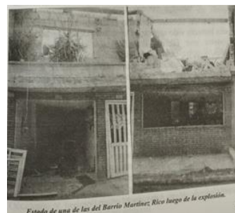
Estado de una de las casas después de la Explosión, 1 agosto 2000.

Otro de los relatos fue el de la señora: