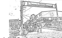
Saberes Danzantes De Martínez Rico.