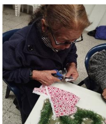
Figura 30 Elaboración de flores