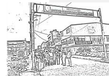
Saberes Danzantes De Martínez Rico.