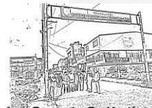
Saberes Danzantes De Martínez Rico.

Por tanto, al reconstruir la historia del barrio en mención, se puede comprender, a través de las narrativas, como su creación expandió la frontera urbana, desplazó otras formas de habitar el territorio y generó lucha por la subsistencia que los llevó a vivir situaciones críticas que han quedado como hitos en la memoria colectiva. Es crucial señalar que el espacio no es simplemente un contenedor pasivo de actividades humanas, sino que es producido y transformado por la acción humana como se logra ver en el barrio Martínez Rico, a través de la estética y organización del espacio. Por esta razón, en esta propuesta se utilizó el espacio como un medio para expresar los sentimientos de aquellos que residen en el barrio, además se generaron nuevas formas de interacción entre las personas y el espacio urbano.