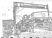
Saberes Danzantes De Martínez Rico.

acontecimientos relevantes durante el ejercicio de los talleres realizados en las sesiones anteriores. El tal sentido, se configuran los acontecimientos presentes y futuros para la construcción del mismo.