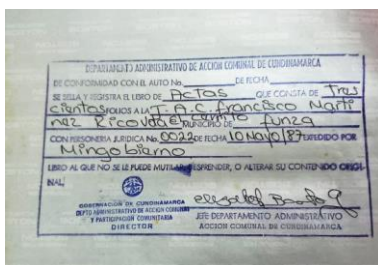
Fotografía de carta de escritura Pública de constitución de la primera Junta de Acción Comunal del Barrio Martínez Rico