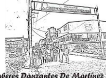
Saberes Danzantes De Martínez Rico.

https://repository.usta.edu.co/bitstream/handle/11634/3988/VelascoAna2015.pdf?sequence=1&isAllowed=y