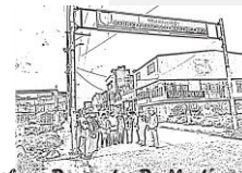
Saberes Danzantes De Martínez Rico.

una historia, un relato, una experiencia sensible; donde quienes la observen, vean ese trabajo de una población que a través de sus saberes, quieren contar toda la vida de una comunidad que siempre ha buscado alcanzar sus objetivos.