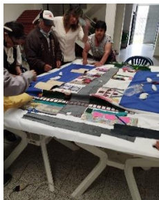
Embelliendo con detalles la Cartografía