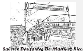
Figura 14 Dibujo realizado por la comunidad