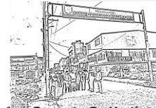
Saberes Danzantes De Martínez Rico.

De esta manera, este taller “ camínemos nuestro territorio ”, cobró una gran importancia, para los adultos participantes ya que no sólo era el hecho de caminar, sino que se permitieron interactuar desde las sensaciones, lo que percibieron, lo mental, como físicamente con este espacio, que por tantos años ha sido su lugar de vivienda, mirarlo desde ese panorama donde quizás por lo repetitivo o cotidiano ya no se detiene a analizar el territorio. Esta actividad por haber sido tan extensa la información era necesaria segmentarla en varios apartes y analizarlos de manera detallada para así llegar a su análisis de manera pedagógica, clara y efectiva.