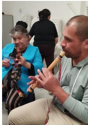
Figura 37 Reconocimiento de instrumentos y sonidos

Terminado este ejercicio, se les preguntó cómo les había parecido el taller y su respuesta fue que les había gustado mucho, La señora Esperanza dice: