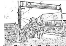
Saberes Danzantes De Martínez Rico.

reconocimiento desde el inicio del barrio, pasando por todo tipo de hechos unos fatídicos, otros de satisfacción pero que finalmente todos forman parte de la Historia narrada por los abuelos del barrio Martínez Rico permitiéndoles a cada uno de los participantes de esta sentir que son parte de ese tesoro de saberes dentro de la sociedad funzana.