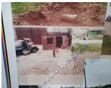
Carro tanque y lugar de la explosión 1 agosto 2000.