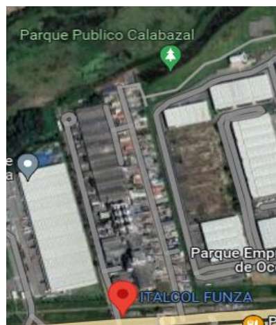
Vista mapa satelital