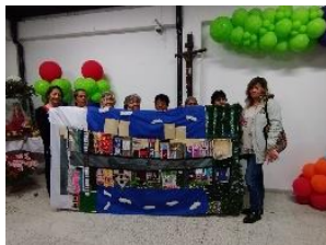
Figura 35 Cartografía social pedagógica