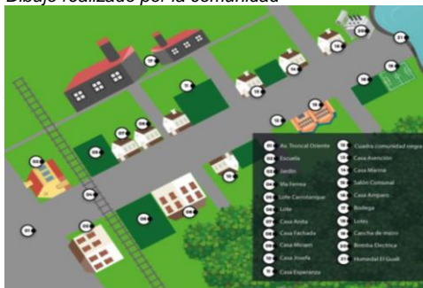
Cartografía social pedagógica Barrio Martínez Rico 2023