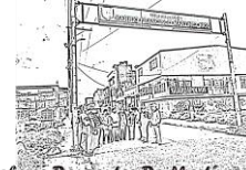
Saberes Danzantes De Martínez Rico.

me deja asomar a la ventana, ya cuando logré reaccionar pues sí ya claro todas las cortinas se habían cortado con los vidrios en nuestro señor médico no entonces bajamos yo y bajé bajamos con mi esposo y buscándolo al niños porque se habían metido en las camas del susto tan terrible, del bombazo tan tremendo, salimos no podíamos salir porque la puerta estaba atorada obviamente estaba atorada por el que pasó y sin embargo pues un vecino llegó y nos abrió salimos y al salir era algo como decir algo como que no, no piensa que va que va a haber alguna vez era una artista se veía altísimo el fogonazo tan terrible.