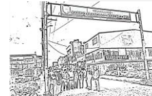
Saberes Danzantes De Martínez Rico.

emoción de angustia, dolor, terror etc. y el segundo recuerda a la paz, a lo natural, a la vida entre otros; cada persona se encargó de hacer una tarea diferente, pero fue importante tener en cuenta que cada uno de los adultos mayores eligió ese sector que quería expresar y cómo lo quería expresar; en principio se empezaron a hacer las casas muy pequeñas ya que ellos querían que se hicieran la mayoría de las casas del barrio, para lo cual se les dio a entender por parte de la docente en formación, que ese era un trabajo guiado y orientado por ella, pero que era autónomo en su elaboración por parte de ellos.