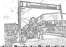
Saberes Danzantes De Martínez Rico.

UNIVERSIDAD PEDAGÓGICA NACIONAL Educación de la vida