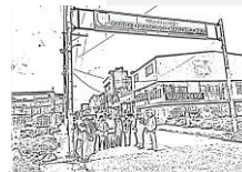
Saberes Danzantes De Martínez Rico.

un lugar digno de habitar y del cual se sienten orgullos de la construcción de memorias que lo componen.