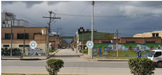
Entrada Principal del Barrio Martínez Rico Avenida troncal de Oriente con calle 25

“Esperanza: Ellos son dueños de la bodega y esto. ..Y acá este acá si es una a la casa de esta última allá sí ve allá, vive pues costeños pero sí Vive gente que ellos quieren t son los dueños de las cabritas, cabras”