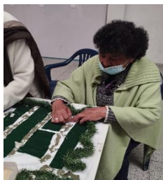
Figura 31 Elab. Detalles humedal