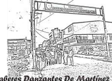
Saberes Danzantes De Martínez Rico.

LIMÓN MENDIZABAL, M. R. (2018, marzo). Envejecimiento activo: un cambio de paradigma sobre el envejecimiento y la vejez. unirioja.es. Recuperado 5 de febrero de 2023, de https://dialnet.unirioja.es/servlet/articulo?codigo=6292831