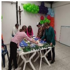
Figura 34 Parte del grupo de Adultos Mayores