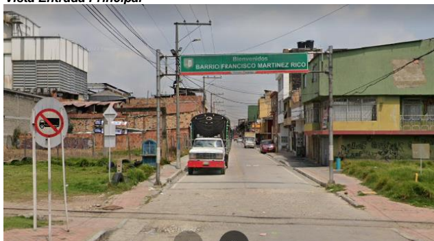
Barrio Martínez Rico 2023

El segundo taller se llevó a cabo a partir de una caminata por el barrio, con el objetivo de obtener información valiosa que permitiera ampliar la comprensión sobre este territorio. Así la caminata fue un espacio pedagógico que desde la experiencia estética se logró visualizar por medio de la exploración la belleza de los lugares que para los adultos participantes podrían ser considerados como simples espacios cotidianos. La ruta se fue construyendo a medida de los relatos, por tanto, no estuvo predeterminada, ya que se buscaba entretejer los recuerdos. De esta forma, los olores, sonidos y sensaciones permitieron conocer el pasado del barrio y conectarse con el entorno de manera más profunda (Páramo, P, 2011)