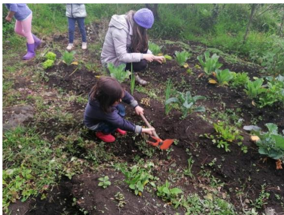
tiempo de trabajo en la huerta.