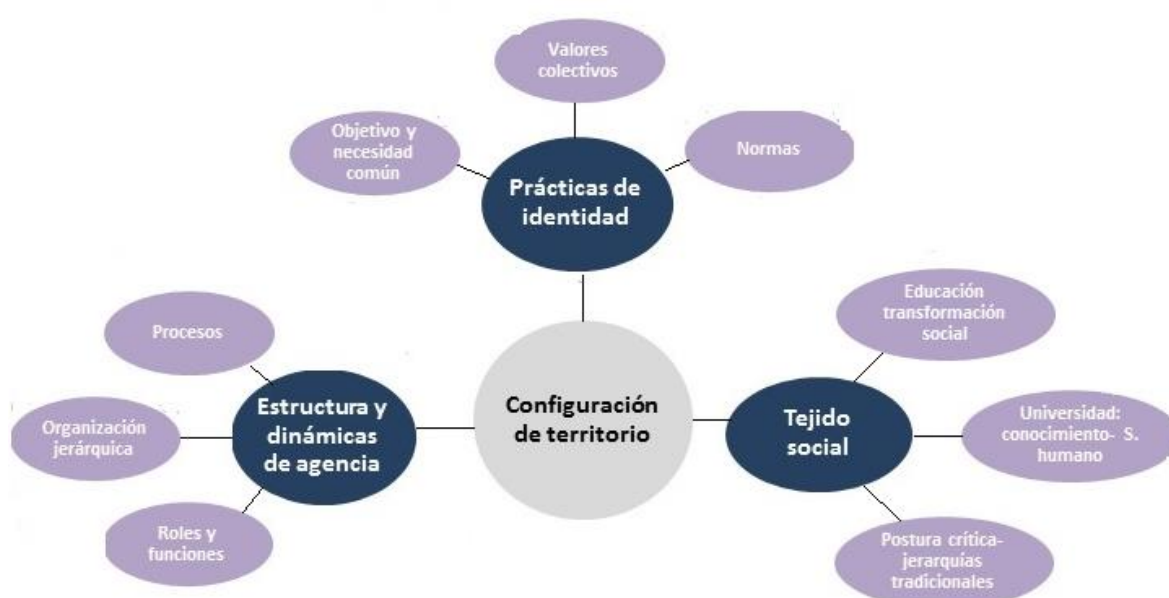
Imagen 1. Esquema Categorías Descriptivas y Analíticas

3. Formas de tejido social referencia a las relaciones significativas que determinan formas particulares de ser, producir, interactuar y proyectarse en los ámbitos familiar, comunitario, laboral y ciudadano.