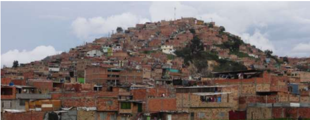
Fotografía 4. Catastro Bogotá, Ciudad Bolívar. 2016

https://www.youtube.com/watch?v=K3G_VDRezls&ab_channel=Lumpen19