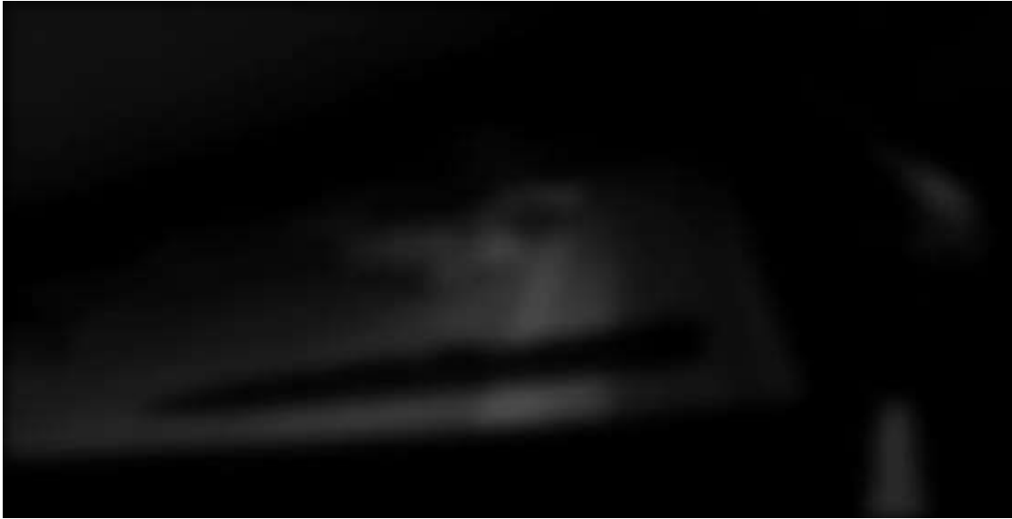
Fotograma 12. Nikolay Amaya. Canción... 2022

que dice: “y los metales afilados debajo del colchón, porque este barrio y en especial este sector, del ochenta al dos mil marco una época de terror (aun)” (imagen 12)