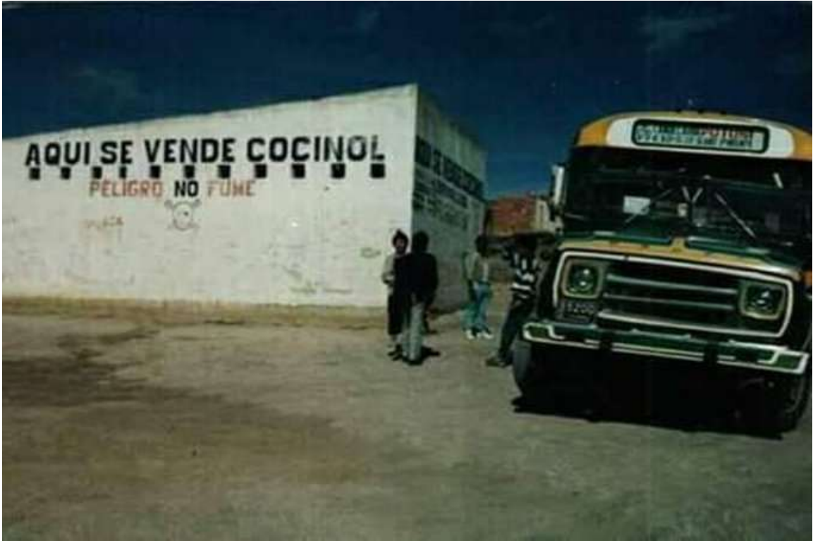
Fotografía 3. Catastro Bogotá. Lugar donde ahora es la Casa Cultural Airubain, años 80.