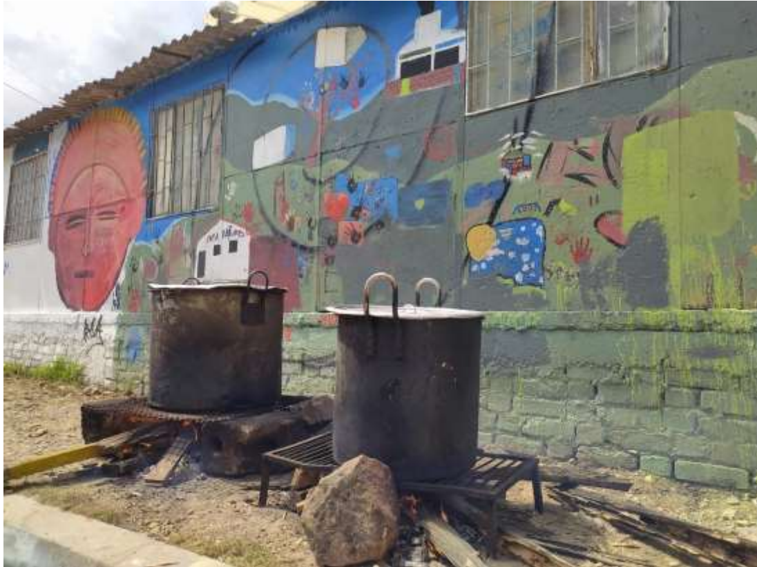
Fotografía 6. Paola Rendón. Casa Cultural Airubain

Era muy normal ver jóvenes reunidos en parques, esquinas o estas casas culturales, realizando alguna actividad en pro de hacer hip hop, los horarios nocturnos por las diversas actividades en las que se ocupaban en el día, les permitía reunirse y compartir sus creaciones y las de otros artistas, dar y escuchar opiniones, pensamientos y críticas, que hacían pulir o mejorar sus actividades, sorprenderse con sus logros y el de los otros y así encontrar satisfacción y plenitud en una práctica cultural, que hoy se encuentra fortalecida por la disciplina y la constancia de diferente artistas, grupos culturales e investigadores de la evolución cultural y artística del ser humano.