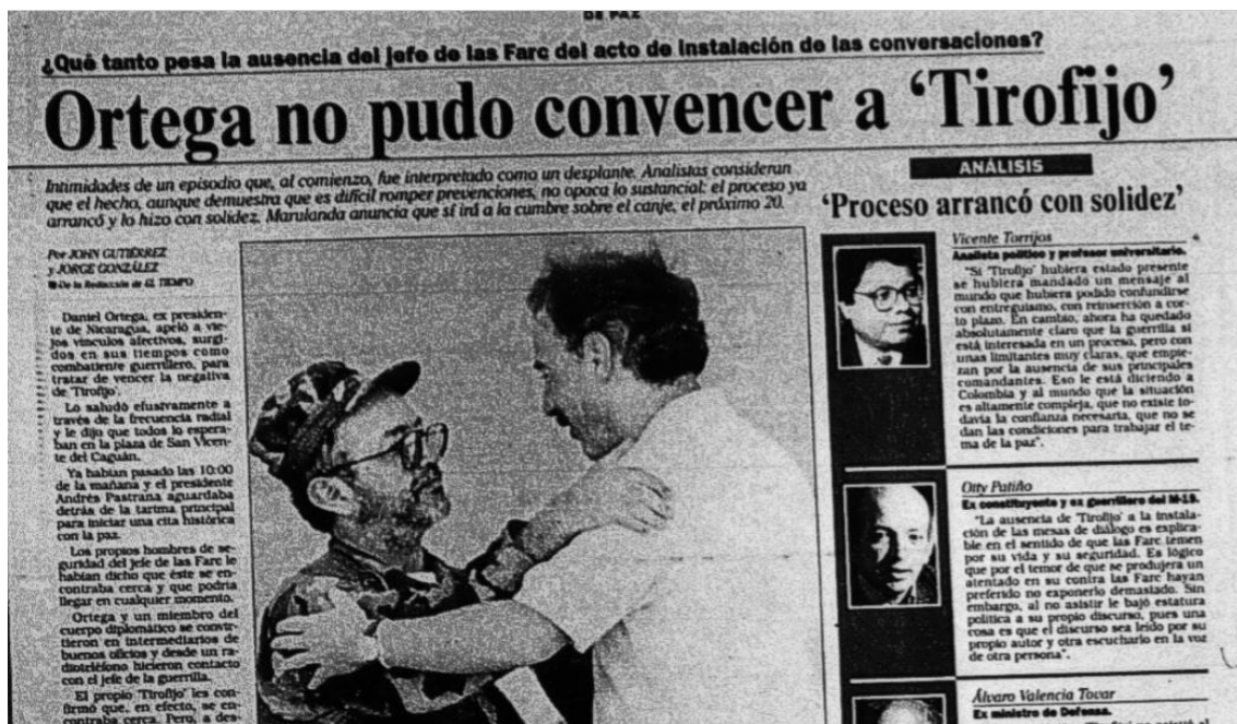
Grafica 1: Tomado del Tiempo 08/01/1999

El hecho que fue conocido como “la silla vacía” fue referenciado en el Tiempo, uno de los medios de comunicación más importantes en dos de sus ediciones, de la siguiente forma: