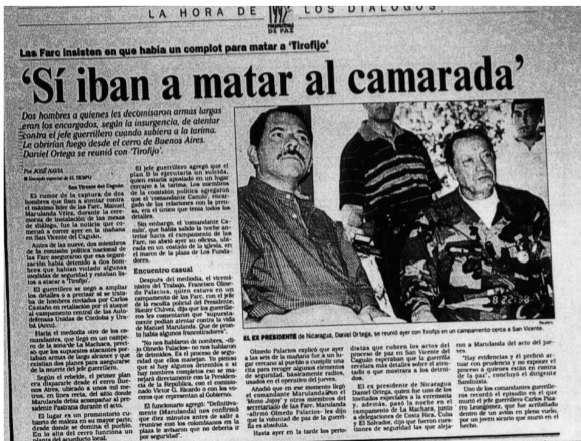
Grafica 2: Tomado del Tiempo 09/01/1999

En medio de este clima inestable, el acuerdo con las FARC cada día se enfrentaba a más retos. Uno de los obstáculos más concretos era la aceptación del proceso entre la sociedad en general, quienes no vieron disminuida la violencia 16 , ya que los enfrentamientos se mantuvieron, contribuyendo a la desintegración del tejido social.