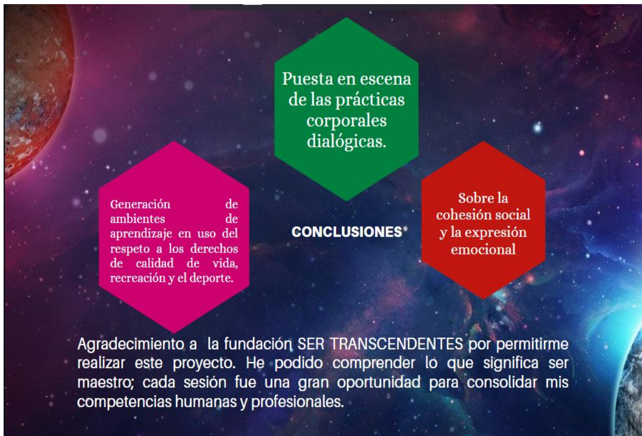
Figura 3: Este gráfico da cuenta de las conclusiones y la importancia de este proyecto en el ámbito educativo.

Este tipo de proyecto precisan de mayor tiempo, mejorar articulaciones en relación con entidades que permitan unos mejores resultados y que aquí se evidencia una necesidad, más en el desarrollo del proceso se evidencian más y no dar respuesta a ellas quedando en el aire por cuestiones de tiempo que no permiten buscar formas de soluciones, lo que conllevo que mi estadía y trabajo con esta fundación se lleve por varios años para dar continuidad a este bello proceso