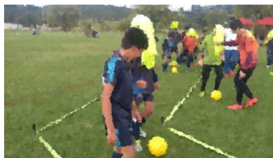
Ilustración 4 foto de la práctica. Fuente Propia