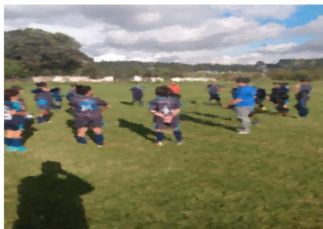
Ilustración 6 foto de la práctica. Fuente Propia