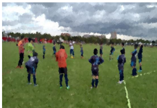
Ilustración 7 foto de la práctica.