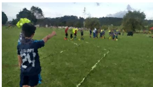
Ilustración 5 foto de la práctica.

Durante la implementación de las prácticas educativas, nosotros como orientadores decidimos realizar la recolección de datos y/o evidencias por medio de imágenes, con el fin de dar cuenta de todo el proceso formativo. Además de que consideramos que, por medio de las ayudas audiovisuales, nos da la facilidad de retroalimentar y entender lo que se busca con la propuesta curricular. Así de este modo, es de mayor facilidad y comprensión para las demás poblaciones donde se quiera llegar, para que así, se logre generar ese impacto transformativo en las realidades que cada sociedad esté sujeta, desde su reconocimiento propio, del otro y lo otro. A continuación, se expondrá las evidencias en relación con la práctica educativa: