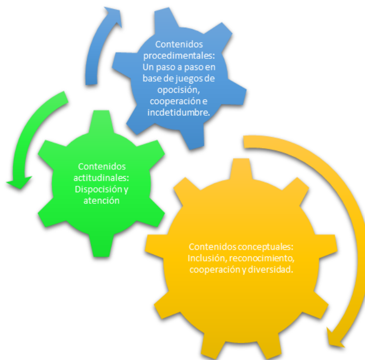
Ilustración 3 conexión de contenidos fuente propia