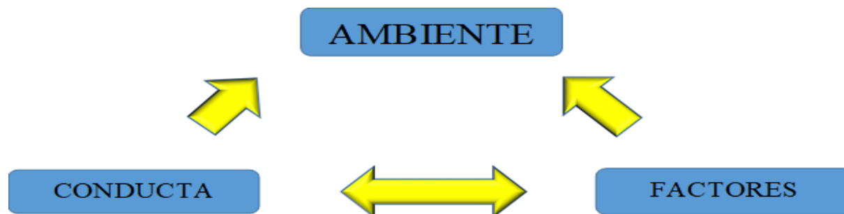
Ilustración 1 explicación teoría social de aprendizaje