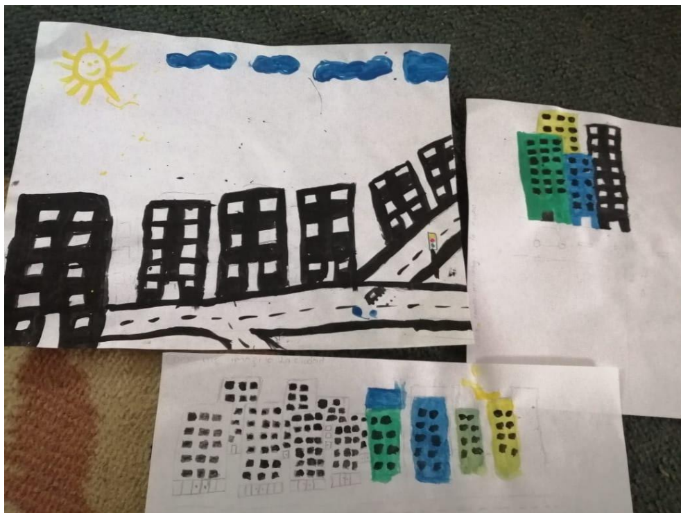
Dibujos de los niños sobre su idea de la ciudad

Si bien es cierto que la ciudad es mostrada por la maquinaria de propaganda capitalista como un mar de oportunidades, para los más pequeños esta percepción ha cambiado en los últimos tiempos, especialmente por la mayor conflictividad social, los fenómenos migratorios (internos y externos) y particularmente la pandemia generada por la COVID-19, con lo cual, se siente que esta percepción puede ir cambiando, sobre todo, porque la situación de aislamiento ha mostrado de nuevo la necesidad del campo como eje sustentador de las propias naciones, a pesar de ser minimizada su importancia y negados los derechos fundamentales a indígenas, campesinos y demás comunidades rurales. Por ejemplo, fue común durante el aislamiento obligatorio en las ciudades que muchas noticias generaran alrededor de los servicios públicos, muchos encarecidos, con debates que dilataban los subsidios a los más pobres y el bajo acceso a estos; mientras en Tierradentro prácticamente no se pagan estos servicios y su gestión es mayormente comunitaria.