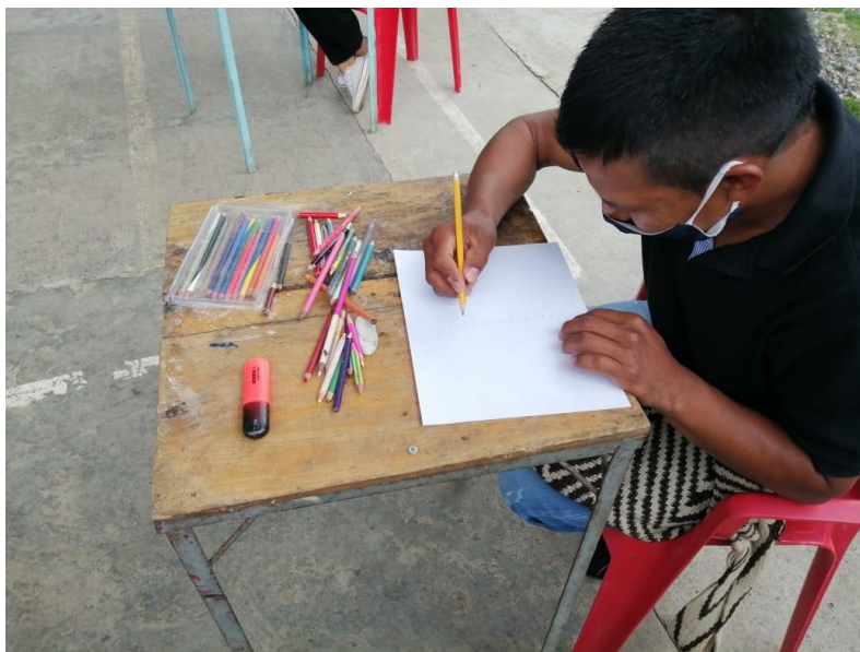
Taller “dibujando mi territorio”, donde se evidencia que entienden los partícipes por el territorio.

Para entender esta relación con el territorio, se parte de los dibujos y conversaciones que se tuvieron sobre este, y el elemento común que sobresale en todos es el espacio de la finca familiar, como el primer territorio. Es de destacar que la organización tradicional nasa se caracteriza por dos elementos particulares en la distribución de la tierra: a nivel familiar, se poseen pequeñas parcelas (minifundios), mientras a nivel colectivo se poseen tierras colectivas que se trabajan de forma de minga para la siembra, o tiene un destino comunitario (para la salud, educación, espiritualidad y organizativos) y son administradas directamente por los cabildos bajo la asamblea comunitaria. La mayoría de estas fincas son microfundios (cerca del 70%), es decir, propiedades menores a 0.5 unidades agrícolas familiares (Instituto de Estudios Interculturales, 2018), que según el IEI de la Pontificia Universidad Javeriana, está entre 8 y 11 hectáreas para el municipio de Inzá (Instituto de Estudios Interculturales, 2013), y debería ser el mínimo que garantice condiciones dignas de ingreso para una familia, con lo cual se puede asegurar que estas