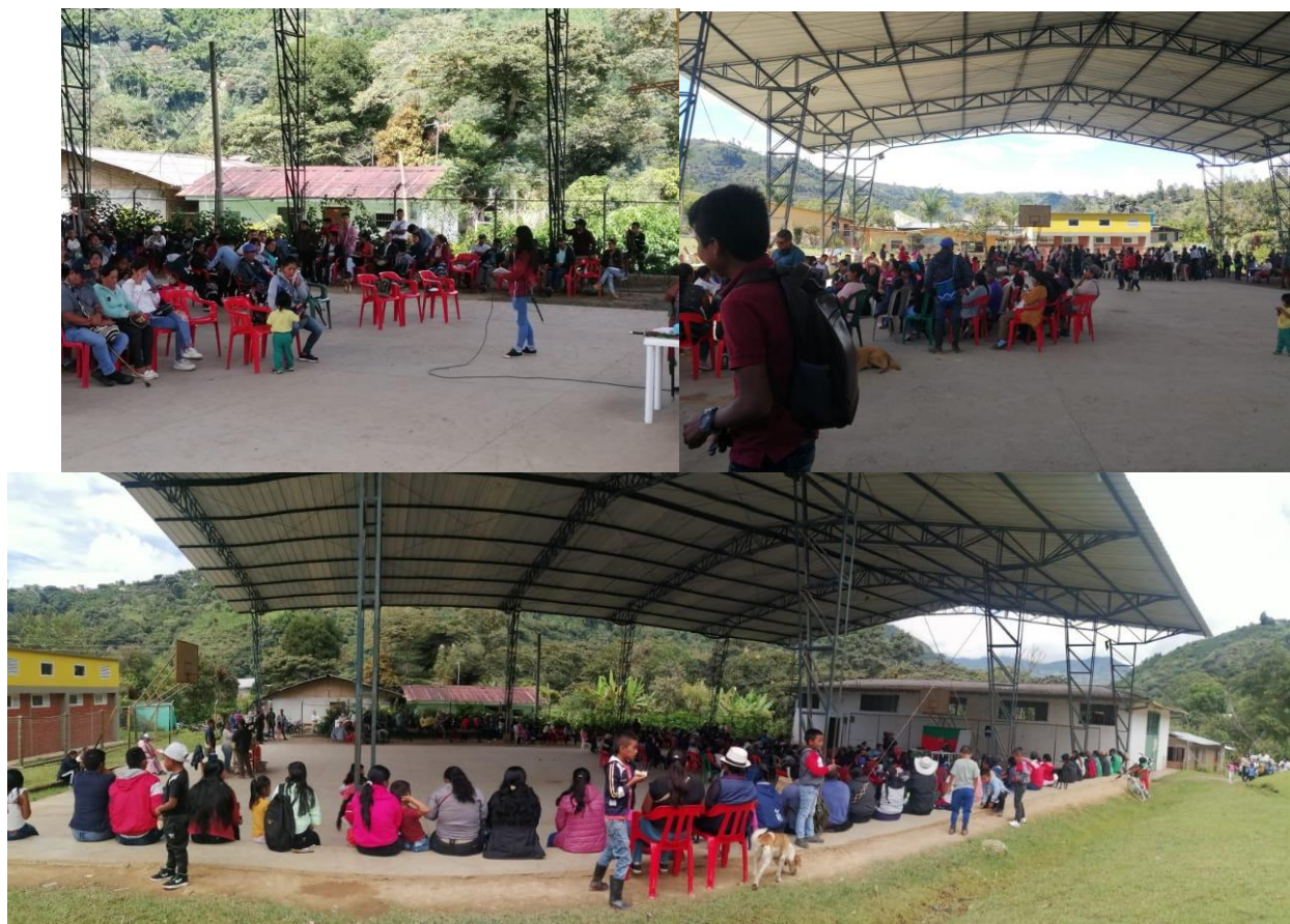
Segundo momento Asamblea Educativa: compartiendo y caminando la palabra.