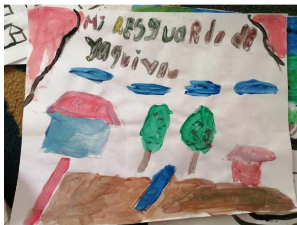
Dibujos sobre el territorio hechos por los niños del resguardo.