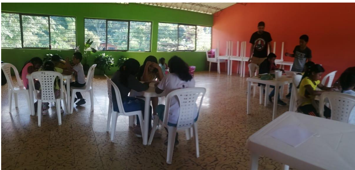
Primer momento de la asamblea educativa: trabajo con niños.