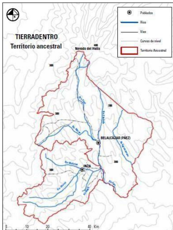
Ilustración 1: Territorio Ancestral de Tierradentro. Datos: información SIG del Departamento de Geografía, Universidad Nacional de Colombia 2010 (Bernal, 2011).

Siguiendo los estudios de Gómez y Ruiz (1999), los nasa habitaban tierras cercanas a las selvas húmedas tropicales ubicadas en las proximidades con el actual departamento de Putumayo, y se fueron expandiendo hacia la parte andina ocupando gran parte de lo que hoy se considera el suroccidente del país, salvo por Nariño.