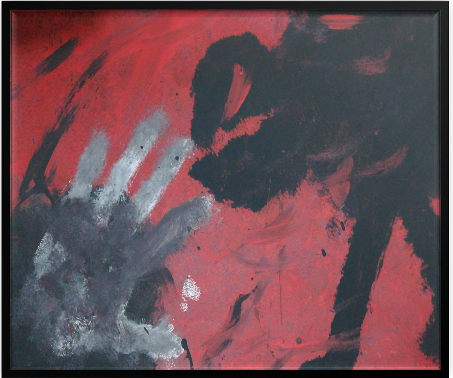
Ilustración 5. 08 de julio del 2019 - Anhelos de cambio.

UNIVERSIDAD PEDAGOGICA NACIONAL Educadora de educadores