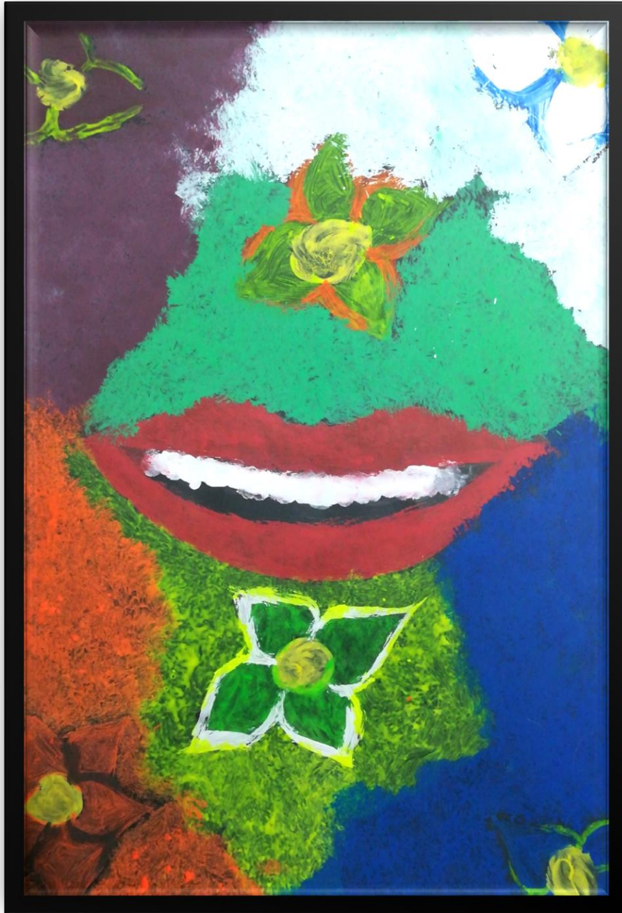
Ilustración 4. 28 de mayo del 2019 - Recuerdos.

UNIVERSIDAD PEDAGOGICA NACIONAL Educadora de educadores