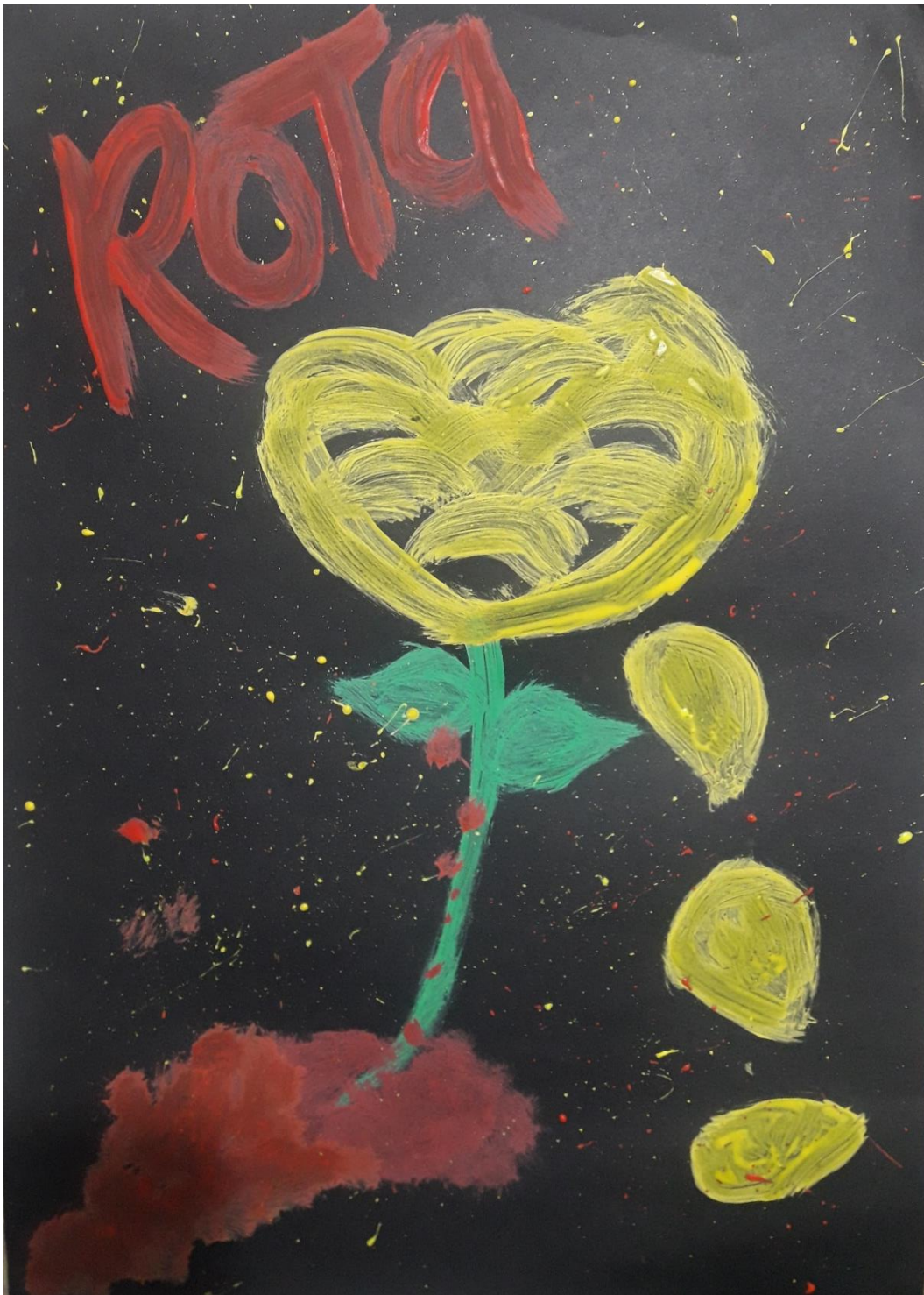
Ilustración 3. 05 de mayo del 2019 - Rota

UNIVERSIDAD PEDAGOGICA NACIONAL Educadora de educadores