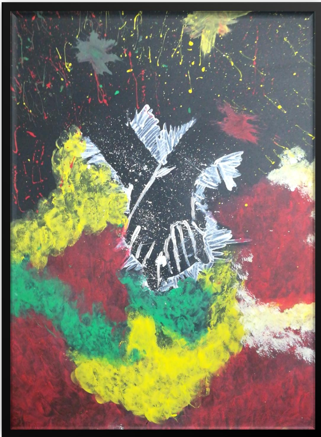
Ilustración 6. 03 de agosto del 2019 - Complicidad.

UNIVERSIDAD PEDAGOGICA NACIONAL Educadora de Educadores