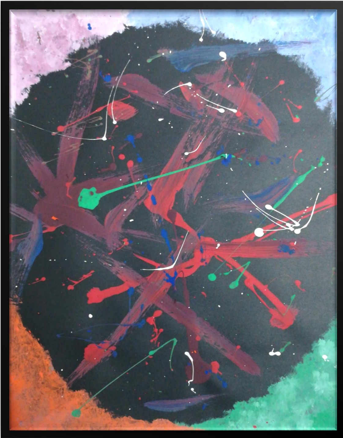
Ilustración 7. 22 de octubre del 2019 - Dolor.

UNIVERSIDAD PEDAGOGICA NACIONAL Educadora de Educadores