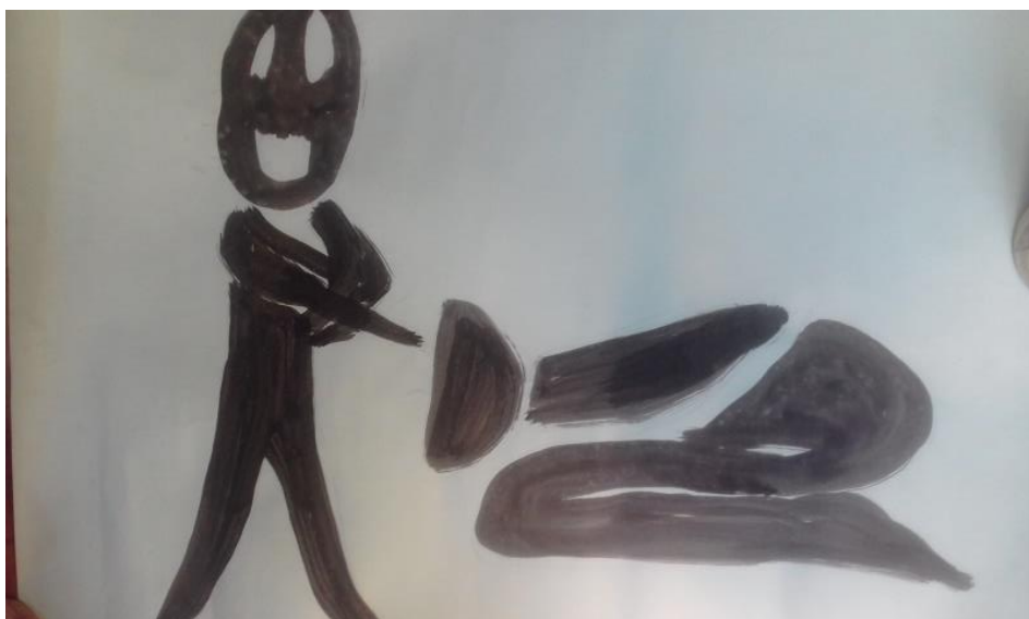
Elaboración Propia. Técnica pintura en tela, para el performance “El Patio”. Noviembre de 2016