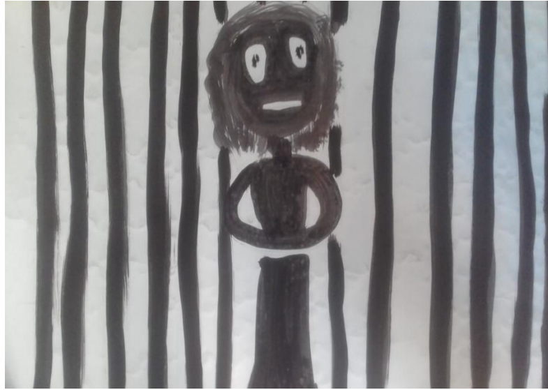
Elaboración Propia. Técnica pintura en tela, para el performance “El Patio”. Noviembre de 2016