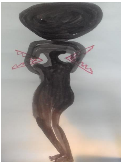
Elaboración Propia. Técnica pintura en tela, para el performance “El Patio”. Noviembre de 2016

¡Eso ya pasaba el límite ¡ hasta ese momento cuando no me chuzaban entonces metían la mano y me apretaba la vagina, mientras otro me apretaba los senos no sé cuánto tiempo pasó, pero fue bastante tiempo yo le pongo más de una hora, no lo sé, después de que todos pasaron por mi cuerpo, lo sé porque se divertían manoseándome. Ellos se burlaban, en un momento se dieron cuenta que yo le había hecho un huequito a la bolsa con mis dientes, fue cuando me dieron cachetadas yo me desmayé y recuerdo que me despertaron de un puño en la cara, desde ese entonces he usado una férula auto relajante