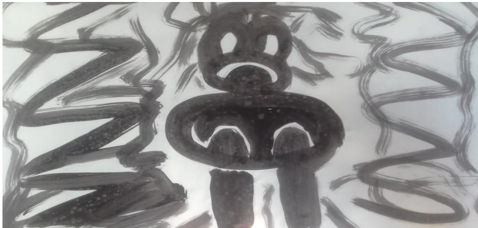
Elaboración Propia. Técnica pintura en tela, para el performance “El Patio”. Noviembre de 2016

Lo único bueno de ese sitio era los postrecitos que daban en la hora del almuerzo, yo le rogaba a mi abogada que por favor nos sacaran de ese sitio como fuera, pero alguien quería que siguiéramos ahí no lo sé con qué función, pero el día que nos llevaron a la cárcel El Buen Pastor, me dio alegría.