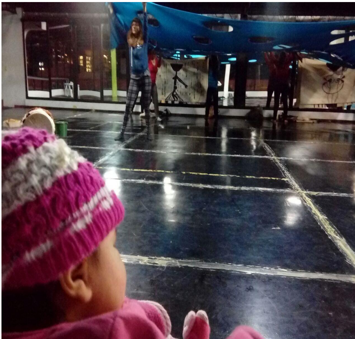
Archivo personal. Fotografía tomada por Yannelle García, en uno de los ensayos de la obra “El Patio”.