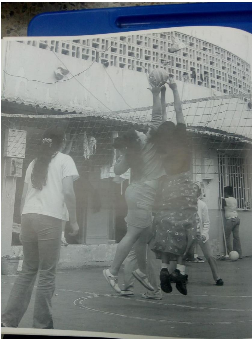
Ilustración 9. Alternativas otras de Sanación- El Deporte