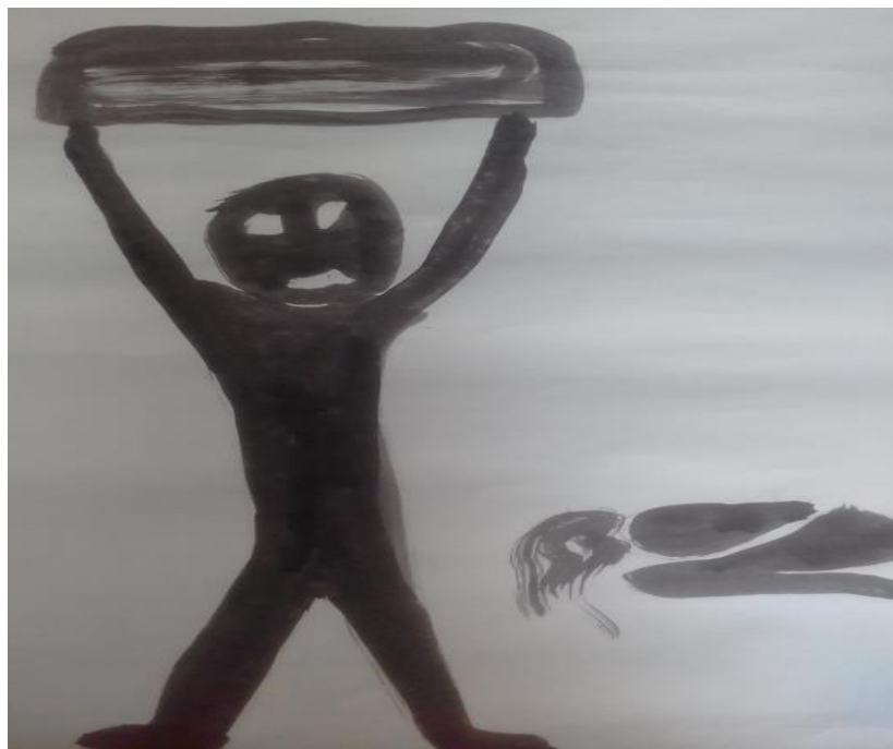
Elaboración Propia. Técnica pintura en tela, para el performance “El Patio”. Noviembre de 2016. Él en mi habitación, disfruta colocarme la bolsa en mi cabeza

Al rato me soltaron la bolsa, pero no me la quitaron y volvían y la apretaban, y mientras él me seguía dando puños en el estómago, otro me tocaba los senos y soltaban la bolsa (podía volver a saborear el aire en mi boca seca) de nuevo la apretaban y esta vez me daban puños en los senos de ahí me quedaron doliendo. Cuando no me daba puños en los senos me los acariciaba el hombre que estaba detrás de mí, como si fueran un trofeo. Cuando tenía la bolsa en la cabeza sentí un dolor muy fuerte en mis pezones, en ese momento soltaron la bolsa y pude ver que tenía unas pinzas en mis senos eran esas pinzas que usan para prender los carros yo rogaba que me las quitaran y que ya pararan de