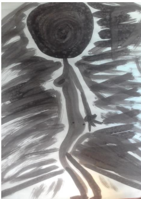
Elaboración Propia. Técnica pintura en tela, para el performance “El Patio”. Noviembre de 2016

No sé ya eran como la 1 o 2 de la mañana cuando nos sacaron de la casa, a mí me subieron a una patrulla de platón de esas que tiene sillas al aire, a mis amigos no sé dónde