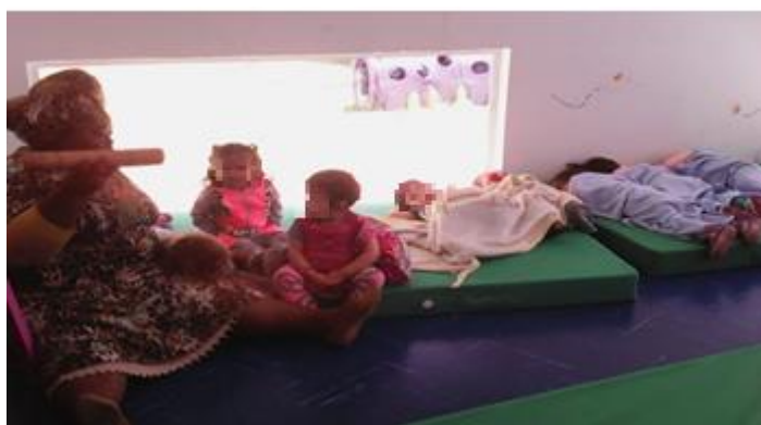
Imagen 8 tomada en el jardín infantil ATA

El tambor es el acompañante de la población afro desde su nacimiento. El tambor es el regalo que dejaron los Orishas a sus hijos/as. Este instrumento conoce, muestra y recrea una serie de códigos ocultos y mágicos, que se muestran a través del sonido y la vibración, el toque del tambor evoca estados corporales en los cuales se crea un lenguaje colectivo común, trasladando así, a las personas a estados emocionales que les permiten recordar y conectarse con los elementos de la naturaleza, desplegando con esto un nuevo conocimiento. (Definición construida en el proceso de construcción de la estrategia el espíritu del tambor por amparo Caicedo y Anyela guanga, el 10 de julio de 2014)