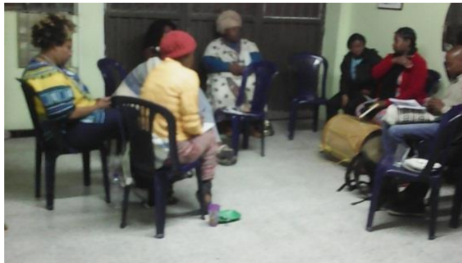
Imagen 5 Tomada a los sabedores y sabedoras en el proceso de construcción de la Metodología de la estrategia.

Este análisis de realidad, genera la propuesta de diseñar una estrategia que pueda llegar donde están las niñas y los niños y no concentrarse en un sólo espacio ya que la atención se restringiría a muy pocos, además coinciden lideresas y líderes en afirmar que la cultura y pensamiento afro y palanquero debe llevarse a todas las niñas y los niños, pues de su conocimiento dependerá el reconocimiento, respeto, construcción, goce y disfrute de la diversidad, por tanto las acciones deben hacerse de tal forma que llegue a