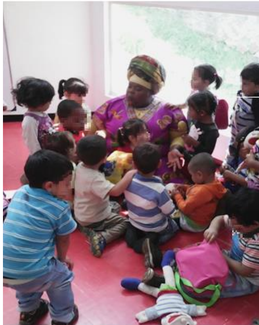
Imagen 4 tomada en el jardín infantil ATA