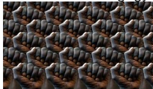
Imagen 1 manos afro

Key words: Knowledge. Identity. Narratives. Pedagogy. Reflection.