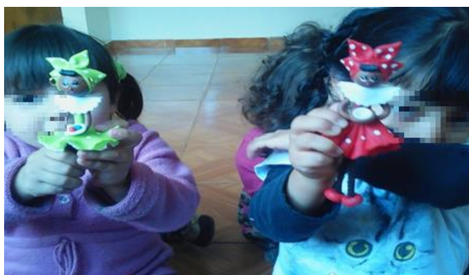
Imagen 9 tomada en el jardín infantil Atanasio Girardot