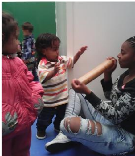
Imágenes 6 y 7 tomadas en la subdirección local de Integración Social de Santafé - Candelaria