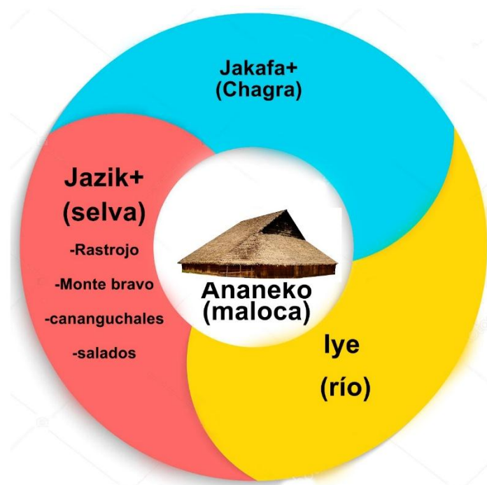
Figura 1. Los cuatro escenarios de Aprendizaje de la cultura Murui

La anterior información es condensada en la figura 1, donde a partir de la espiral se explica como se manejan estos espacios tradicionales de enseñanza Murui.