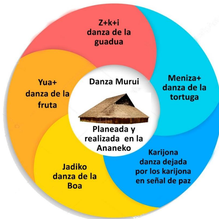
Figura 3. El canasto de la danza Murui

es de destacar el movimiento y la gran actividad física que requiere, además que sus letras y significados son una incógnita para los Murui.