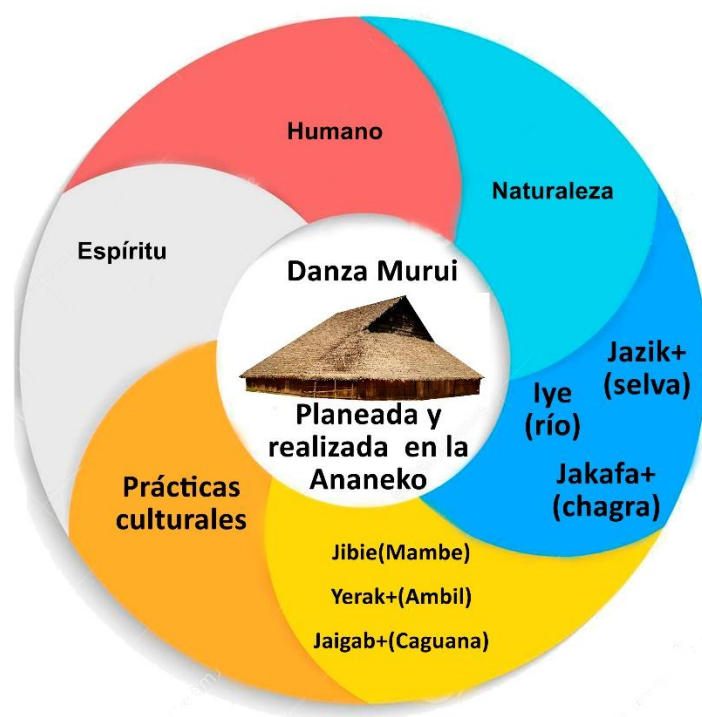
Figura 6. Espiral de relaciones.

“por ejemplo el baile es una actividad justamente para eso, si, digamos es para armonizar la relación entre la naturaleza el espíritu y el hombre, si entonces esas tres dimensiones que se tiene entonces lo que digo es que replicar conocimiento porque si no hay conocimiento como podemos manejar el medio ambiente”