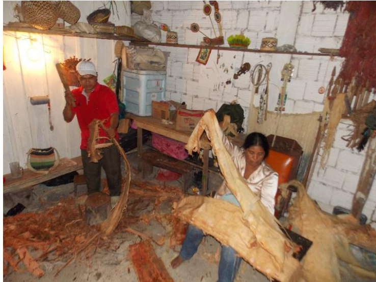
Fotografía 15. Elaboración de trajes para baile.

Teniendo en cuenta lo anterior se puede decir que la forma en la que los Murui adquieren sus conocimientos es compleja y holística, y requiere gran tiempo de dedicación, el Murui aprende durante toda su vida, desde su corta edad el escuchar al abuelo para cimentar las primeras bases de la cultura como la lengua y la oralidad, el acompañar a los padres a la chagra y hacer recolección de frutos, tomar un camino de aprendizaje donde se especializará, aunque es de aclarar que esto no implica dejar de lado las interrelaciones entre los conocimientos de la medicina con la danza u otros, las interrelaciones que se encuentran dan respuesta a la gran cantidad de conocimientos y saberes que ellos tienen y manejan acerca de la naturaleza, para Farekatde,G. (2018, pág. 45) lo anterior se puede resumir en: