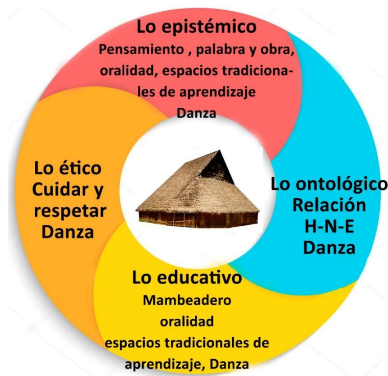
Figura 7. Diagrama de síntesis del apartado

“nosotros no nos formamos para generar recursos para generar ganancia para generar riqueza, no , nosotros nos formamos , o la idea de formación de nosotros es formar personas serviciales, buen abuelo esa es la meta de nosotros” (Farekatde,2018).