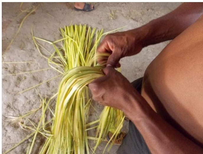
Fotografía 12. Elaborando trajes.

La fotografía 12 muestra como el uso de algunas plantas especialmente las palmas permite que el Murui obtenga desde su techo, hasta su comida a partir de la fabricación de algunas trampas, este uso racional y manual de lo que hay a la mano, es una de las claves para que el Murui resista y perviva su tradición.