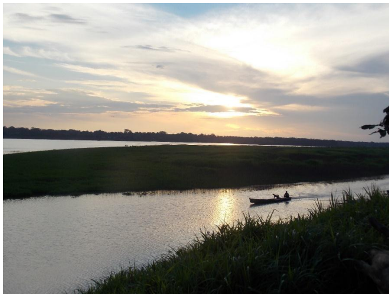
Fotografía 4. El Río.