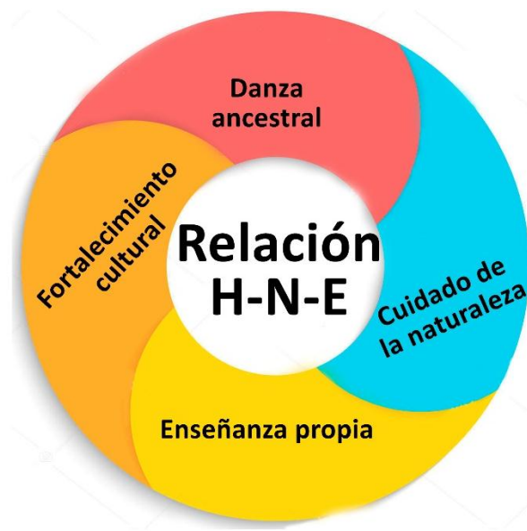
Figura 5. Diagrama de interrelaciones.

Las categorías de análisis que se tendrán en cuenta se manejan desde algunas dimensiones identificadas a lo largo de la investigación, estas son la dimensión epistémica, ética y educativa y una cuarta categoría la cual es emergente y es la ontológica(ver figura 5) cada una relacionada a la danza ancestral y a la importancia de la enseñanza o educación tradicional Murui.