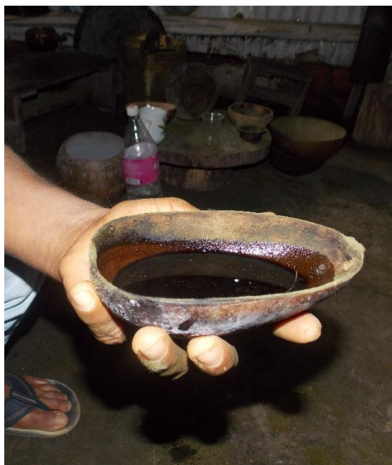
. Fotografía 8. Yeraco Totuma de ambil.

El Yerako(ver fotografía 8), es una totuma de tamaño pequeño en la cual se deposita yerak+ (ambil) el cual se obtiene del tabaco ( Nicotiana tabacum ) la relación del Murui con esta planta es importantísima para la pervivencia de la cultura Murui.