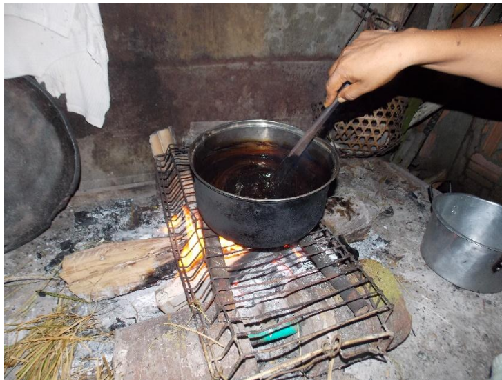
Fotografía 7. Preparando Yerak+ (ambil).

Mientras se hacía el ambil uno de los miembros del grupo me enseñó un canto corto, este canto se me permitió escribirlo y grabarlo lo que me facilitó su aprendizaje, mediante este canto mejoré la pronunciación de algunas palabras que me habían enseñado previamente, comprobando en carne propia que el canto estimula el aprendizaje de la lengua y por ende la lengua vive en la medida que vive el canto.