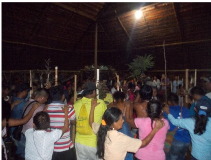
Fotografía 13. Baile de Z+k+i, Xingú

La forma en la que se danza en el baile de Z+k+i, es en espiral, existe una unión corporal con la guadua con la que se golpea el suelo fuertemente generando sonidos al unisono con el de los pies y voces que van repitiendo lo que el cantor principal va cantando, cada vez que el cantor para, el resto del grupo levanta la voz dándole energía a la danza y dando espacio para que el cantor retome la letra, mientras tanto cada uno está pendiente del paso del que le sigue para formar el círculo o la espiral que se forma con la unión de otros hombres y mujeres que con sus voces le dan una nota de ancestralidad al momento.