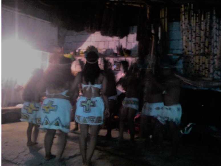
Fotografía 11. Danza Z+k+i.

A este lugar llegan indígenas que están interesados en hacer pervivir su cultura, así se encuentren lejos de su territorio, la vida en Leticia se vuelve más amena para ellos al tener un lugar donde compartir la palabra, Zafiama, E. (2018) afirma: