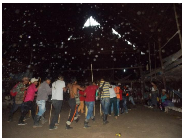
Fotografía 14. Baile Carijona km 7.

La relación que mantiene el Murui con la naturaleza y el espíritu es una relación que no está desligada, y se ve en el diario vivir de ellos, en la danza, en la palabra y su entorno (ver fotografía 14), para el Murui no existe una diferencia entre su ser y lo natural, el Murui es naturaleza y es ese brazo de la naturaleza hecho para protegerse, de aquellos a quienes de alguna forma se han desvinculado de la naturaleza sea por la sociedad en la que viven o simplemente por estar expuesto al aparato publicitario y educativo de occidente (Gutiérrez, E. 2018) .