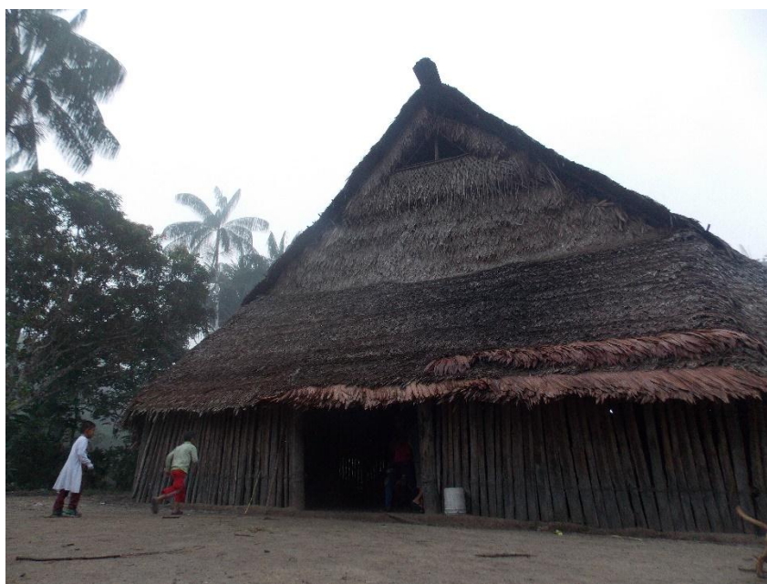
Fotografía 2. Ananeko (Maloca) .

El centro del conocimiento para los Murui está en la Ananeko(ver fotografía 2), y específicamente en la sabiduría de los abuelos que se reúnen todas las noches para hacer amanecer la palabra en el círculo de la palabra o jibib+r+, la Ananeko se constituye como el centro de la cultura Murui, y por ende en un lugar de protección cultural.