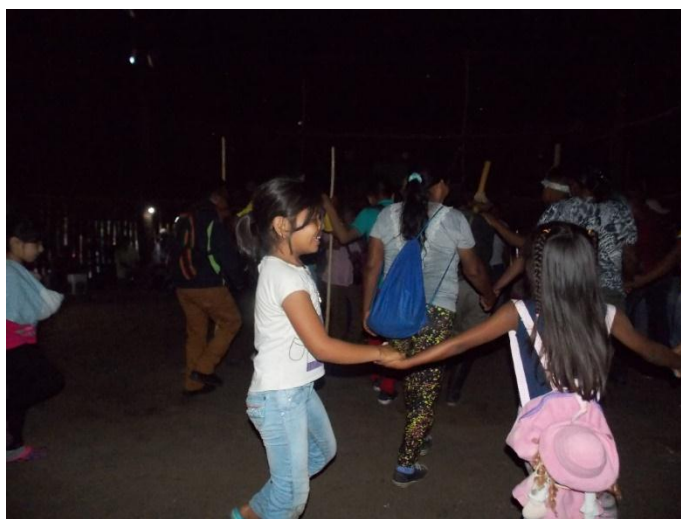
Fotografía 19. La danza Murui como memoria colectiva, niños participando del baile Carijona.

pueblos, y por otro lado, como una forma de defensa del territorio, de la naturaleza de la cual dependemos todos los seres que habitamos el planeta, como seres racionales y en evolución es necesario ver que evolucionar no es sinónimo de destruir, y racional no es en todos los casos sinónimo de inteligencia, la inteligencia está en comprender que dependemos un 100 % del entorno y el resultado de nuestras acciones como humanidad están en detrimento de la naturaleza, es necesario tomar acciones que contribuyan al cambio y mantener las tradiciones de nuestros pueblos originarios es un gran paso en esa meta.