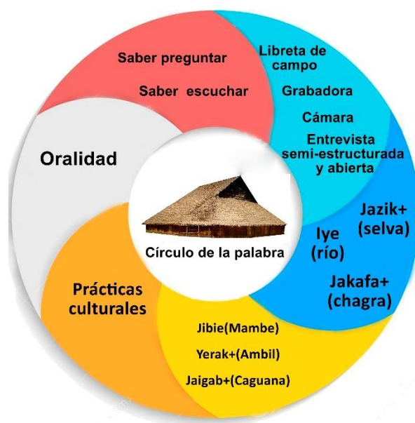
Figura 4. Diagrama de síntesis del apartado metodología

La aplicación de las entrevistas se hizo a 5 miembros del grupo, tres profesores, el abuelo del grupo y la señora que fundó el grupo en Leticia. (anexo 3)