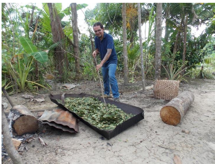
Fotografía 9. Proceso de tostado de coca

Este proceso de hechura de mambe es un proceso reflexivo, que se debe hacer con la mente puesta en él, ya que se debe estar muy concentrado para realizarlo bien, es por lo general un trabajo del hombre. En la fotografía 9, observamos una parte del proceso la cual es el tostado de la hoja de este paso depende en gran medida el sabor y por ende la calidad del mambe o jibie.