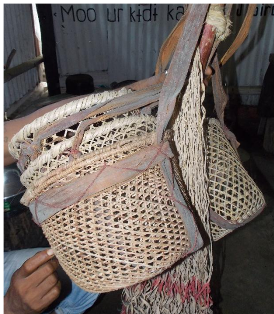
Fotografía 16. El K+r+g+ (canasto),Fuente: Gutiérrez,2018

los mismos( matemáticas, física, química, etc), el Murui es de pensamiento holístico y su conocimiento esta tejido como el canasto 15 (ver fotografía 16).