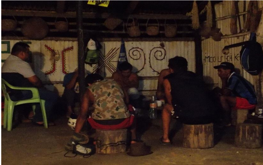
Fotografía 18. Jibib+r+ Círculo de la palabra.

En el círculo de la palabra surgen esas preguntas y esos gustos por ciertas narraciones, allí nace la complejidad de la enseñanza del Murui, la danza como la conocen los Murui requiere de bastos conocimientos sobre la naturaleza sobre el clima sobre cantos etc. y solo para realizar un baile se requiere de la articulación del pensamiento, palabra y obra para establecer la necesidad del baile, después de que se ha decidido realizar un baile es porque se cuenta con una chagra lo suficientemente grande como para abastecer la comida y la caguana de cientos de personas por toda una noche, y lo anterior ha requerido necesariamente de una cantidad de tiempo tanto en el pensador aprendiendo a escuchar, como otra gran cantidad de tiempo en sus lugares de aprendizaje tradicional que es donde hace práctica de lo escuchado en el círculo de la palabra, ahora bien, se debe tener en cuenta que para realizar un baile se deben tener conocimientos sobre los cantos y este tema es especialmente amplio y profundo, ya que al tratarse de una cultura basada en la oralidad, el indígena Murui debe aprender estos cantos de memoria sin hacer uso de la escritura o medios tecnológicos, y aun así aprenden los cantos de una forma impresionante llegando a acumular en su memoria cientos de cantos que vinculan diversas relaciones con la naturaleza y su cuidado.