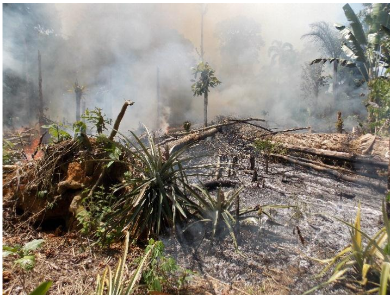
Fotografía 10. Quema de monte.