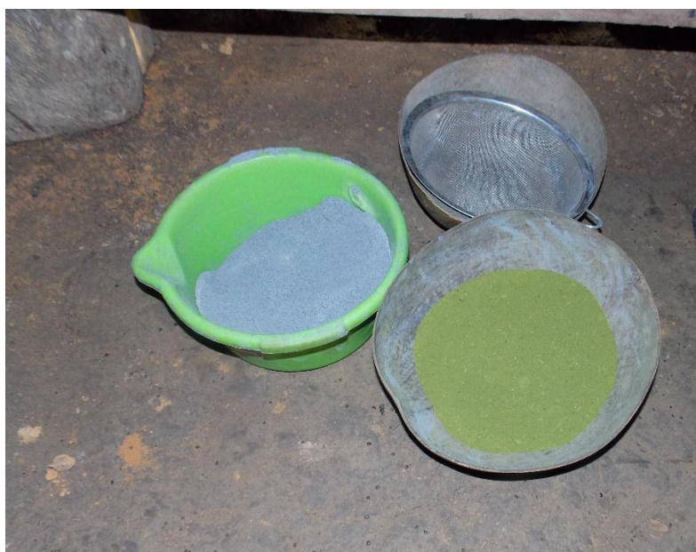
Fotografía 6. Jibie (Mambe).

Durante esa misma noche pude presenciar que mientras ellos iban dialogando, iban haciendo el mambe o jibie (Ver fotografías 5 y 6), el Uzuma (abuelo Silva) era quién se encargaba de repartir a cada miembro una cucharada de mambe, y cada miembro a su vez intercambiaba el ambil y su propio mambe, mostrando así una fraternidad de grupo.