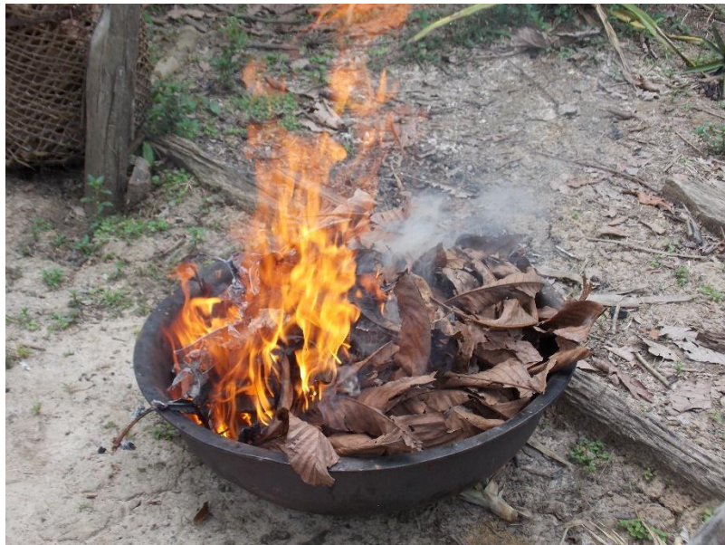
Fotografía 5. Quema de Yarumo.

Ya en contexto, las relaciones humanas. Trabajo de campo, diseño y aplicación de herramientas y técnicas.