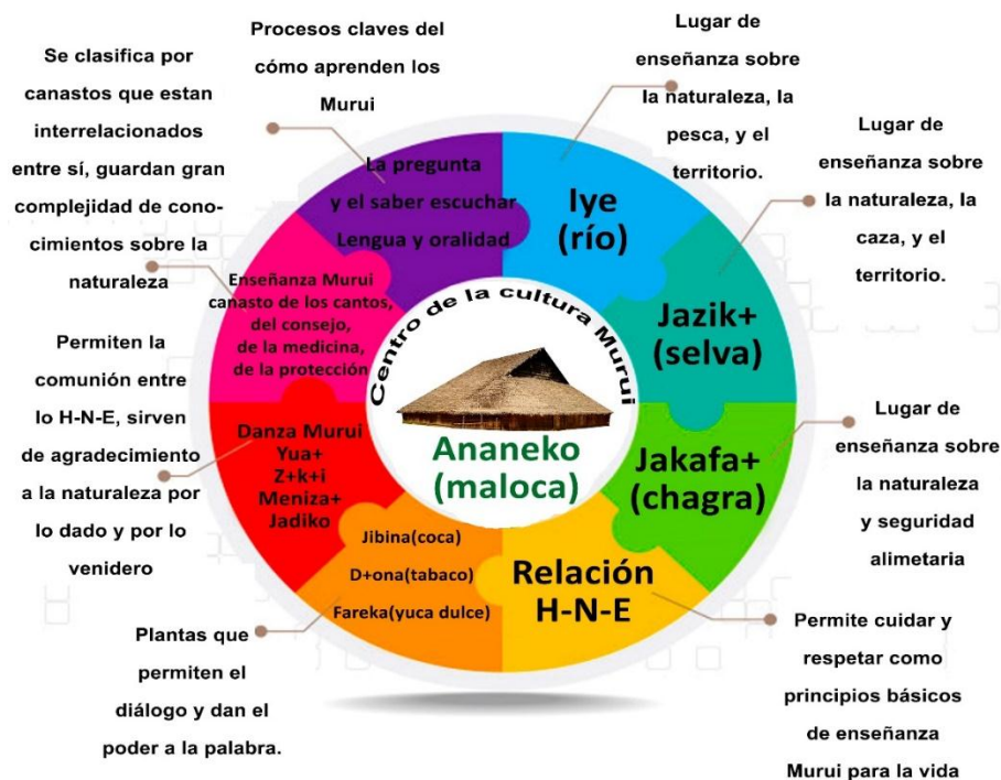
Figura 8. Diagrama de síntesis del apartado

pueda articular particularidades del pueblo Murui como los espacios de enseñanza tradicional con la enseñanza de las ciencias y formación ambiental potencializando los procesos de enseñanza aprendizaje tanto de indígenas como de occidentales, además propone que el maestro ,el territorio y el estudiante también son puentes entre conocimientos.