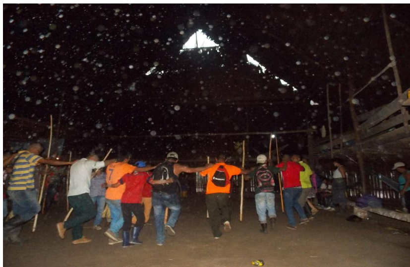
Fotografía 17. Cierre de baile Carijona.

muy tempranas, lo ético sería transversal al aprendizaje Murui y va ligado al pensamiento palabra y obra de cada individuo. lo ético consiste en seguir el consejo de cuidado y respeto del abuelo sobre la naturaleza.