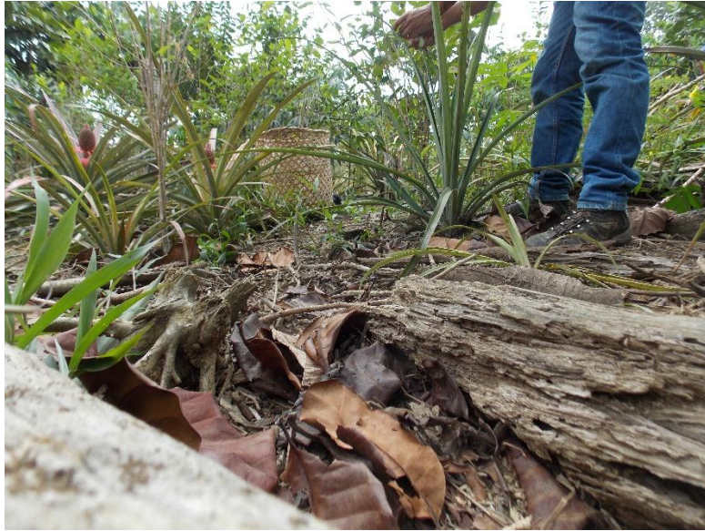
Fotografía 3. La chagra.

El río es otro de los espacios de aprendizaje tradicional