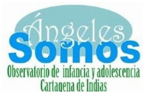
Figura N°2. Logo del observatorio “Ángeles Somos” de la ciudad de Cartagena.

respuestas a los niños, los niños pidieron que hubiera una organización que los acompañara para poder implementar la ley 1098 en el contexto de la ciudad. En ese momento es cuando nace el observatorio.” 58