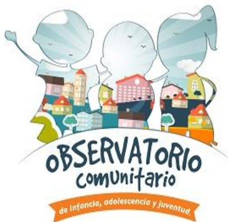
Figura N°7. Logo del Observatorio Comunitario de Infancia y Adolescencia, World Vision Colombia, 2016.

En la segunda fase del piloto fue aplicada la metodología diseñada para la implementación en las dos ciudades seleccionadas: i) presentación del modelo de observatorio a los integrantes de los equipos de WV de las dos ciudades, ii) presentación del modelo al voluntariado, iii) presentación del modelo a las autoridades locales, a instituciones de salud e instituciones educativas socias, iv) capacitación sobre el enfoque de derechos y de protección al voluntariado, v) capacitación sobre los targets y sus instrumentos de medición, vi) toma de datos, vii) procesamiento y análisis, viii) socialización de resultados, ix) planificación de acciones.