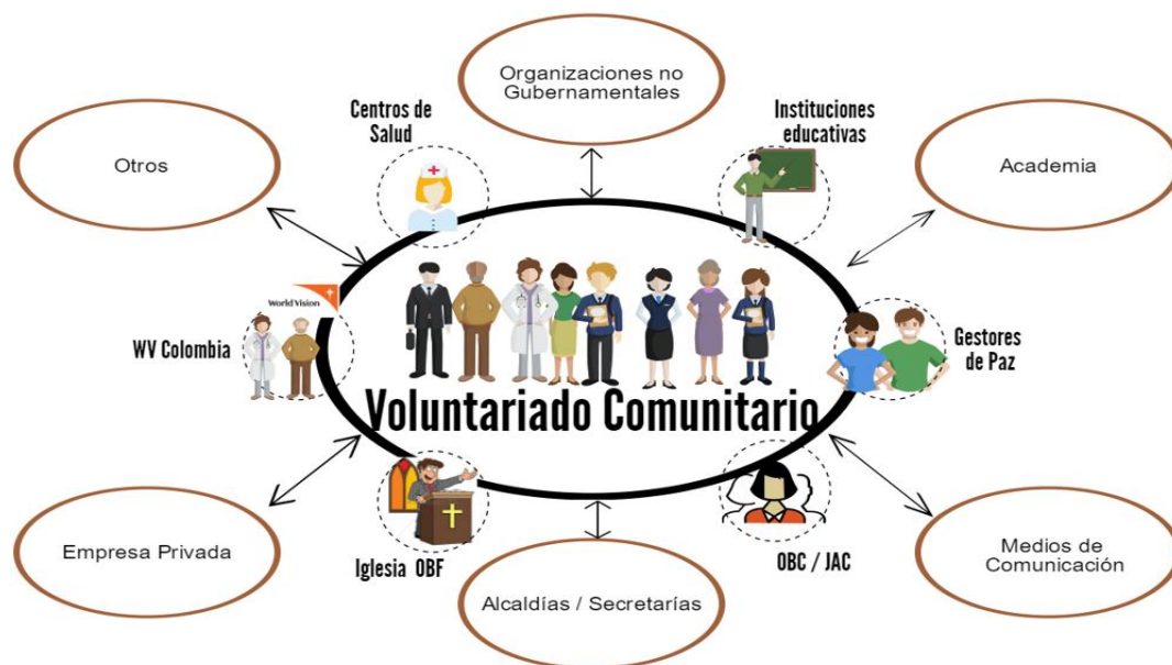
Figura N°6. Esquema de participantes en el Observatorio Comunitario de Infancia y Adolescencia, World Vision Colombia, 2016.

En esta segunda época del observatorio hay una intencionalidad mayor de profundizar la comprensión del voluntariado sobre los marcos y conceptos clave, sobre las técnicas e instrumentos de investigación, sobre la calidad y procesamiento de los datos, sobre el análisis y los resultados y, sobre su utilidad para la acción comunitaria y la gestión para la incidencia pública. En una frase: el observatorio pretende mayor empoderamiento comunitario del bienestar de la niñez como observadores ciudadanos.