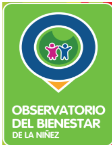
Figura N°4. Logo del Observatorio del Bienestar de la Niñez, ICBF.

funcional: monitoreo de los derechos de la niñez, delitos contra la niñez, niñez y conflicto armado y, sistema de responsabilidad penal para adolescentes. 78