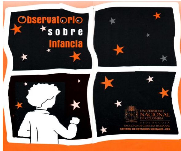
Figura N°3. Logo original del Observatorio sobre Infancia de la Universidad Nacional de Colombia.

Ese año 1999, con motivo de la celebración de la primera década de la Convención de la ONU sobre los Derechos del Niño, el OBSI realizó dos coloquios y un encuentro interuniversitario sobre los derechos de la niñez y la juventud. A partir de entonces, el observatorio ha mantenido en debate público la situación de la infancia mediante los coloquios, el análisis de política pública, investigaciones y publicaciones. Su identidad como observatorio académico retomó las tres líneas misionales de la universidad: docencia, investigación y extensión, pero en esta última línea no tanto de tener acciones en una comunidad, sino de incidir en las decisiones nacionales.