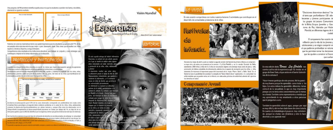
Figura N°5. Boletín del proyecto Observatorio de Infancia, WVCOL Medellín.

Desde el proyecto Observatorio de Infancia también se publicaron varios boletines mensuales para socializar con la comunidad los resultados de las indagaciones y ser un instrumento para la capacitación en los temas medidos. También se pretendía con ello posicionar al observatorio y dar a conocer a World Vision y su trabajo.