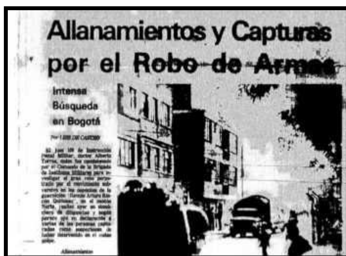
Tomado de: El Espectador, miércoles 3 de enero de 1979.