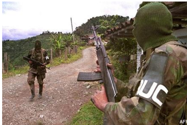
Fotografía 1: (Minuto 30)