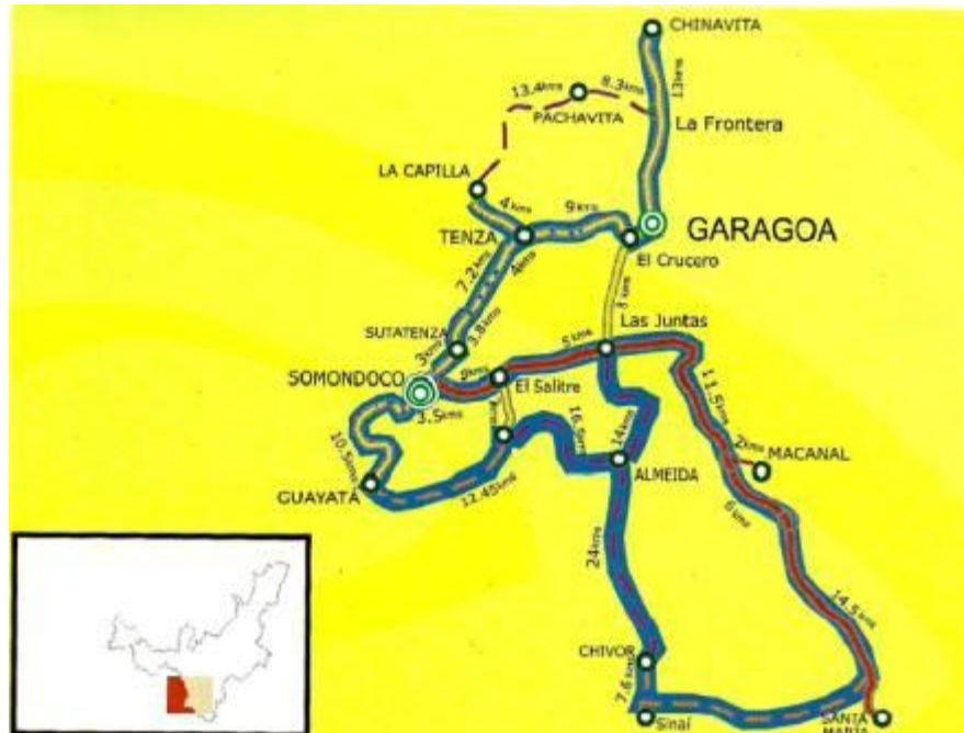
Mapa 4: Valle de Tenza