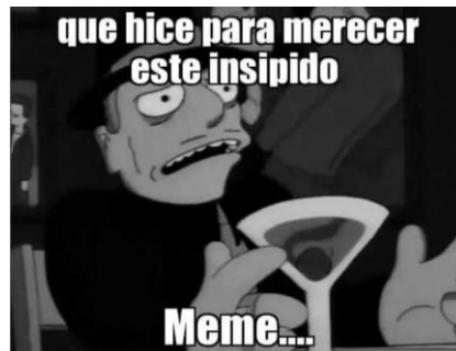
Ilustración 1: Meme, retomado por un estudiante de 1102 IPN.

En las redes sociales actuales circulan imágenes creadas por diversas personas cargadas de significados únicos de los medios, aludiendo a hechos generalizados por una gran cantidad de usuarios, una de esas imágenes y un referente especial de esta investigación, lo son los memes.